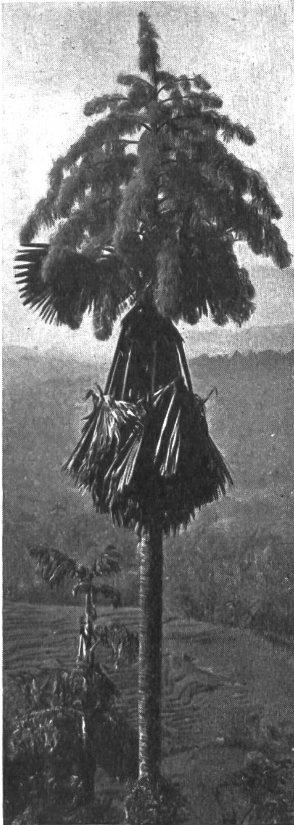
Abb. 1. Die blühende Livistona rotundifolia -Palme, die sich majestätisch in der javan. Landschaft erhebt, bildet einen wunderbaren Blütenstrauss, dann aber stirbt sie ab.

zungsschicht zwischen Rinde und Holz, bleibt ebenfalls jung, und dieser Mantel von dauernd und rhythmisch weiterlebendem Pflanzenkörper steckt wie eine Haube über dem Holzskelett, bildet und vergrößert dasselbe. Es altert also eigentlich der Holzstamm oder die Baumform, bis sie auseinanderbricht. Aber auch an einem gestürzten Baum könnte ein guter Gärtner noch Zweige schneiden und sie weiterkultivieren. Nun ist es aber recht interessant, zu sehen, was alles diese immerjunge Partie machen kann. Im einen Falle wachsen alle Triebe in die Höhe, ohne sich stärker zu verzweigen, und der Stamm beginnt, wie beim Kletterstrauch und der Liane, zu winden. Im anderen Falle breiten sich die Triebe bald aus und bilden eine breite Krone. Der eine Baum formt eine monumentale Säule, wie manche Palme, die mit ihren grossen Wedeln als königliches Geschöpf dasteht, die aber, wenn einmal oben der prächtige Blütenstrauss erscheint, mangels Verzweigung absterben muss (Abb. 1). Andere, wie etwa unsere