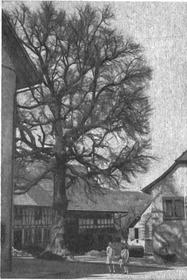
Abb. 3. Die alte Dorflinde, die als Freiheitsbaum vor 150 Jahren gepflanzt worden sein soll, zeigt mit ihrer kunstvoll aufgebauten, in starke Äste unterteilten Krone eine grosse Anpassungsfähigkeit. Ja, man kann in der Krone ganze junge Bäumchen entdecken, denen nur die Wurzel fehlt, um selbständig zu sein.

Ganz merkwürdige Formen entwickeln manche Baumarten in den heissen Ländern. Das Bild 4 zeigt einen tropischen Feigenbaum. Er trägt keine essbaren Feigen, aber er wird riesengross. Es gibt alte Bäume, bei denen man nicht mehr weiss, ob man noch von einem Baum sprechen kann oder ihn besser als Wäldchen bezeichnen muss, obwohl alles aus einem einzigen Samenkorn hervorgegangen ist. Die ausladenden Äste treiben Senkwurzeln, welche sich, einmal in den Boden gelangt, rasch verankern und zu Stämmen auszuwachsen beginnen. Mit der Zeit steht ein vielstämmiger Bestand da, nur dass die Krone oben ein zusammenhängendes Ästegewirr bildet. In sumpfigen Küstenstrichen gibt es sogar Feigenbaumarten, welche gewissermassen einen starken, flachliegenden Stamm auf reihenweisen Stützen tragen. Ein solcher Baum kann auch durch irgendeinen Zufall getrennt werden