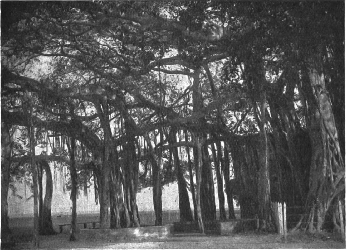
Abb. 4. Es ist nicht möglich, bei diesem prächtigen Naturgebilde, einem Banyan-Baum Javas, zu entscheiden, ob das eine oder mehrere Pflanzen sind. Die Bäume mit ihrer unerhörten Lebenskraft werden in Indien und Java gerne vor Tempeln gepflanzt, so dass sich die Bevölkerung im Schatten des hainartigen Riesenbaumes aufhalten kann.

und dann in Form von zwei selbständigen Einzelpflanzen weiterwachsen.