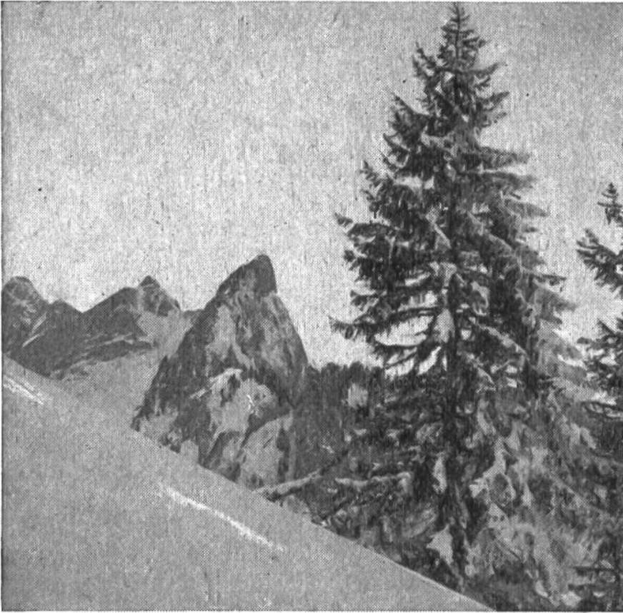
Abb. 2. Wir alle empfinden die eleganten Spitzen unserer Fichten und der meisten anderen Nadelhölzer als sehr schön. Wir können uns die Gebirgslandschaft ohne sie kaum denken, und doch wird ein solcher Baum durch eine Beschädigung viel mehr getroffen als die Laubbäume und kann auch weniger die Gestalt wiederum erneuern.

Nadelhölzer, haben einen durchgehenden Stamm; daran stehen schön regelmässig die Seitenäste, nach oben immer kleiner werdend, bis die Kegelkrone in eine vom Stamm gebildete Spitze ausläuft (Abb. 2). Wie knorrig und unregelmässig ist dagegen eine Eiche oder eine alte Linde. Über dem kräftigen Stamm setzen die mächtigen Hauptäste in Mehrzahl an und verzweigen sich wirr bis zu den letzten Laubtrieben. Wird diese Form beschädigt, so kann sie sich viel besser ergänzen als das Nadelholz. (Abb. 3.)