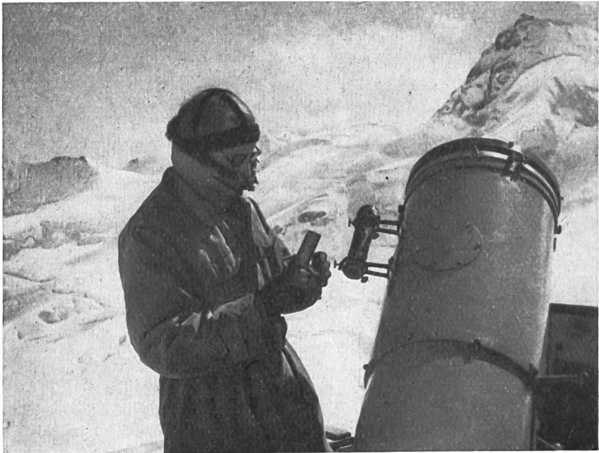
Arbeit mit einem Spiegelteleskop auf dem Dach des Sphinxobservatoriums (3570 m ü. Meer).