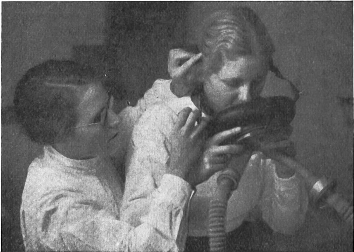
Untersuchung der Atemluft einer Studentin nach Arbeitsleistung.

geheimnisvolle Strahlung, welche in der Höhe noch mit besonderer Stärke feststellbar ist, die sogenannte kosmische Strahlung. Es handelt sich dabei um einen Regen von unregelmässig mit ungeheurer Energie auftreffenden Teilchen, die sowohl durch die Mauern des Instituts als auch durch den menschlichen Körper und sogar durch dicke Bleischichten hindurchgehen und die von einem bisher noch nicht bekannten Ort im Weltall herkommen. Auch Ärzte arbeiten hier und studieren den Einfluss des verminderten Luftdrucks in der Höhe auf den menschlichen Körper. Natürlich ist besonders die Fliegerei in hohem Masse für das Ergebnis dieser Untersuchungen interessiert; die täglich viermal vorgenommenen Messungen des Barometerstandes, der Luftfeuchtigkeit, Temperatur und Windrichtung dienen für die Wettervorhersage und das Flugwesen. Die Forschungsstation enthält die notwendigen Laboratorien und Apparate und dazu bequeme Schlaf-, Koch- und Aufenthaltsräume, da die Untersuchungen oft Monate dauern, das Leben in dieser Höhe nicht leicht und die Arbeit durch die Luftverdünnung noch erschwert ist.