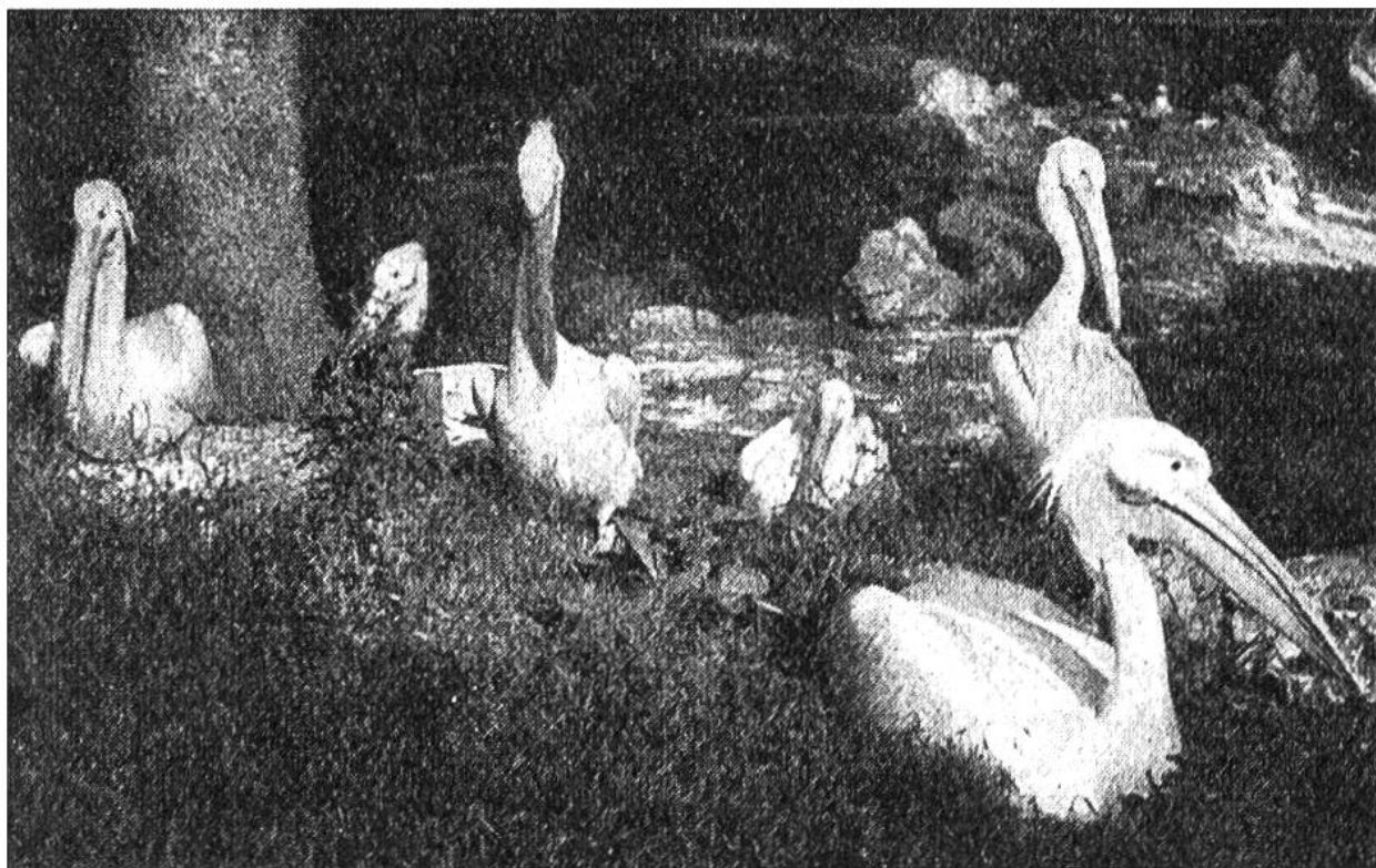
Rosenpelikane im Basler Zoologischen Garten.

Niststellen. Der Kopf mit dem ungewöhnlich langen Schnabel wird beim Fliegen auf die Schulter zurückgezogen, und oft bilden die Pelikane hoch in der Luft riesige Geschwader, die in tadelloser Formation ihre Kreise ziehen. Das Rauschen ihrer Schwingen, die zu mächtigen Tragflächen ausgespannt sind, hört man weithin auf der Erde.