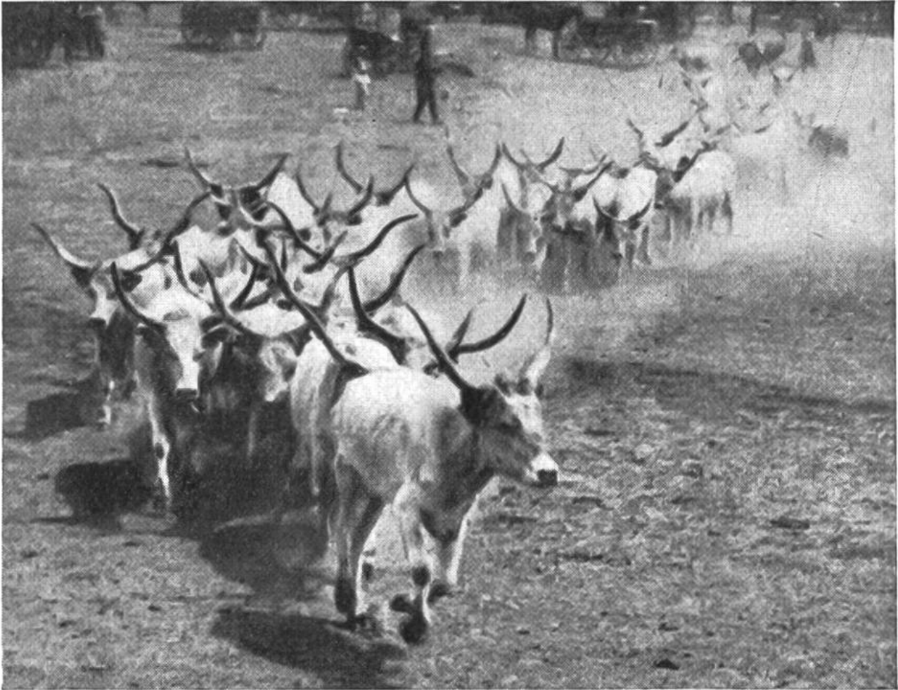
Ein Trupp langhörniger ungarischer Rinder folgt dem Leittier in die Ebene hinaus.

benutzt, sieht Sandinseln, Schilf, Weiden, Auenwälder, staunt über den Reichtum an Fischen und Vögeln, begreift auch, dass früher landeinwärts der Steppenwolf gehaust. Erst durch Menschenhand wurde die Puszta, die ursprüngliche Waldsteppe, in waldlose Grassteppe umgewandelt.