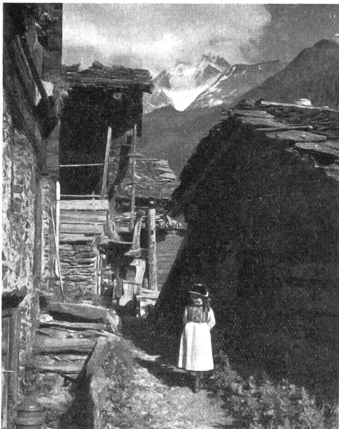
Häuser und Berge im Gleichgewicht (Bietschhorn zwischen den Hausgiebeln). Mädchen vor der dunkeln Hauswand, wo es hell hervortritt.

nügend Abstand ein, damit deine „Opfer“ auf dem Bilde weder den Kopf noch die Füße verlieren. Verlass dich nicht auf den äussersten Rand im kleinen Spiegelsucher, gib lieber etwas Spielraum. Unterlass Kopfstudien (Nahaufnahmen) mit einer Linse gewöhnlicher Brennweite, wegen der unfehlbar sich ergebenden perspektivischen Übertreibung (Nase zu