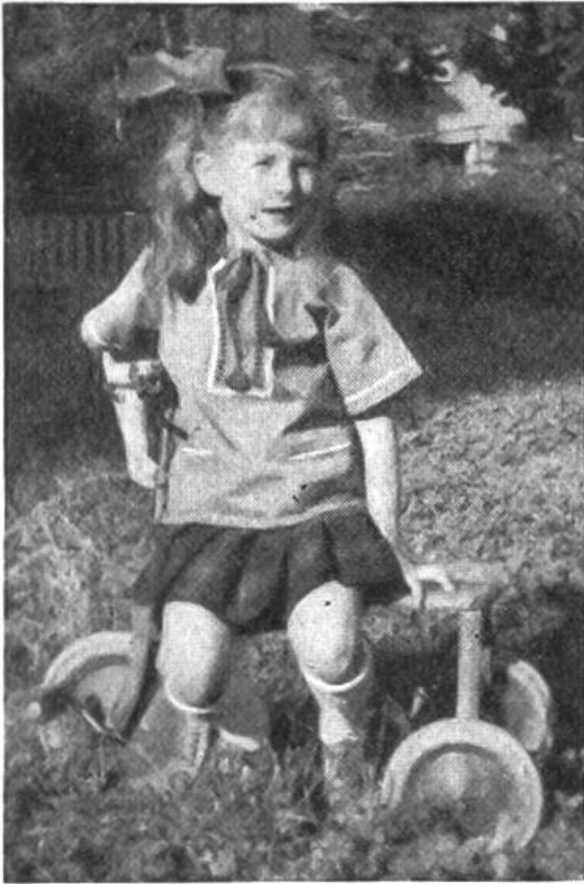
In dem bequemen Kitteli lässt sich's gut spielen.

reihe von Hand annähen. Der Saum wird von Hand an die Stielstiche angenäht. Taschen mit versetztem Stielstich in Weiss verziern, den Taschensaum nähen und die Taschen auf das Kitteli mit der Maschine nähen. Saum am Ärmel und Ärmelnaht nähen. Ärmel mit Kehrnaht an das Kitteli nähen. Halsbündchen anstürzen. Vorn, auf jeder Seite vom Schlitz, für das Bündeli ein Löchlein ausnähen. Bündeli dünteln oder drehen, durch das Halsbündchen ziehen und mit kleinen Quasten abschliessen. Bei langen Ärmeln kann man vorn in den Saum ein Elast oder ein Bündeli hineinziehen.