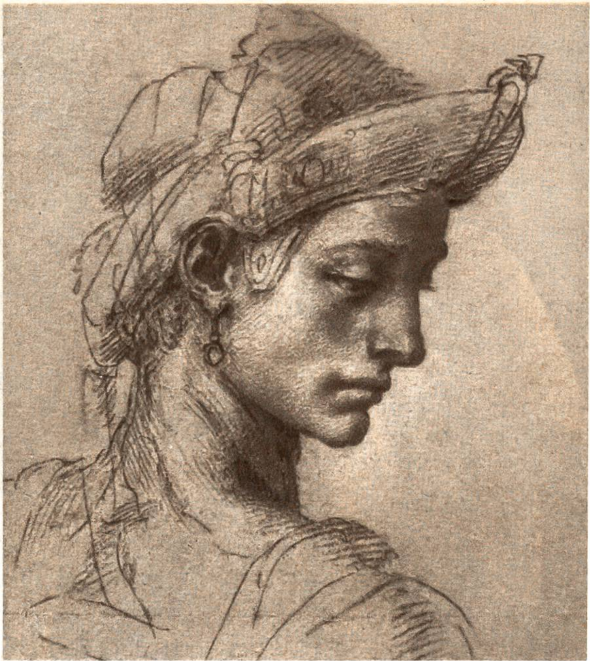
Frauenkopf, Zeichnung von Leonardo da Vinci, Florenz, 1452-1519.