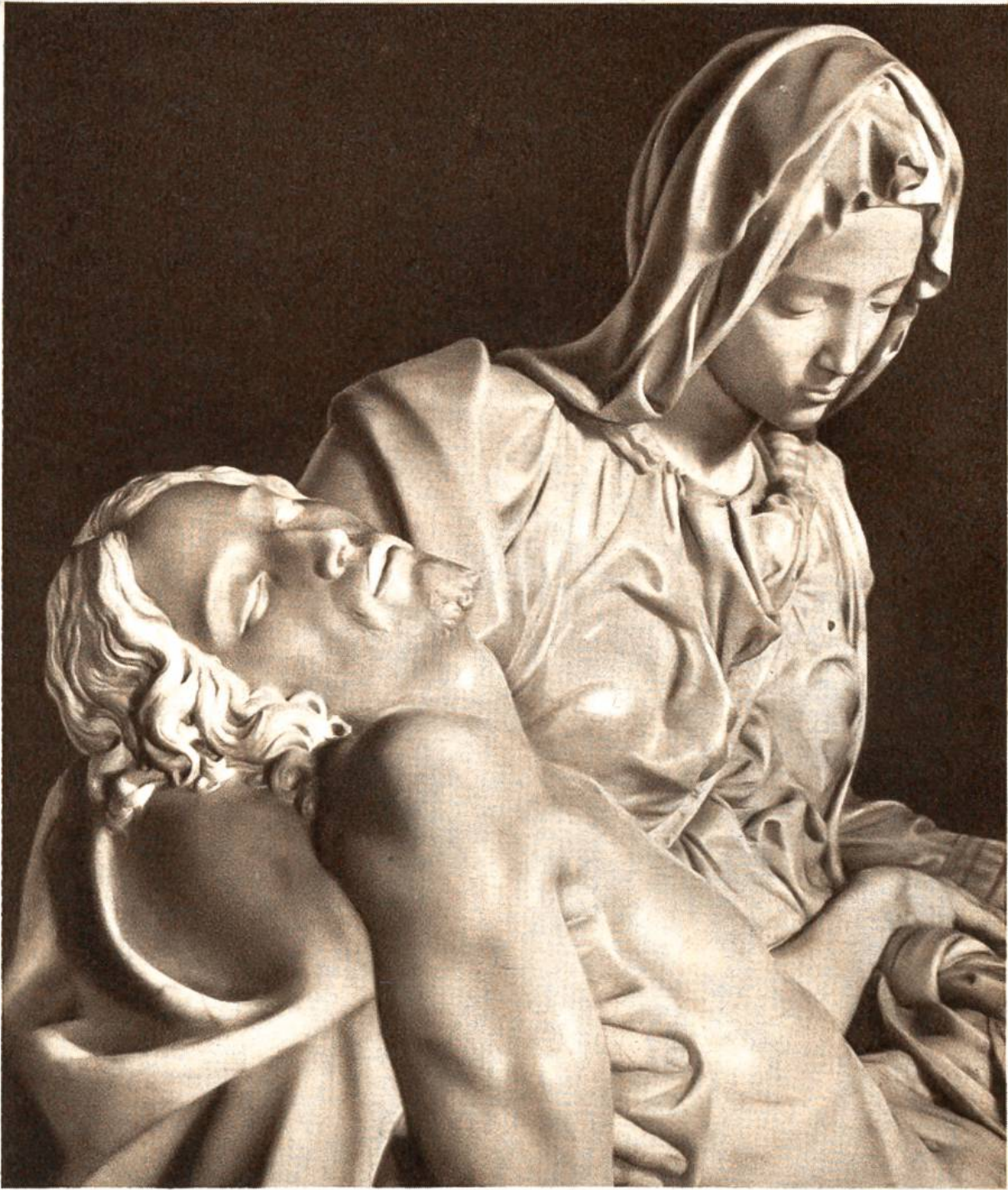
«Pietà», Teilstück der Marmorgruppe von Michelangelo, Rom, 1475 - 1564.