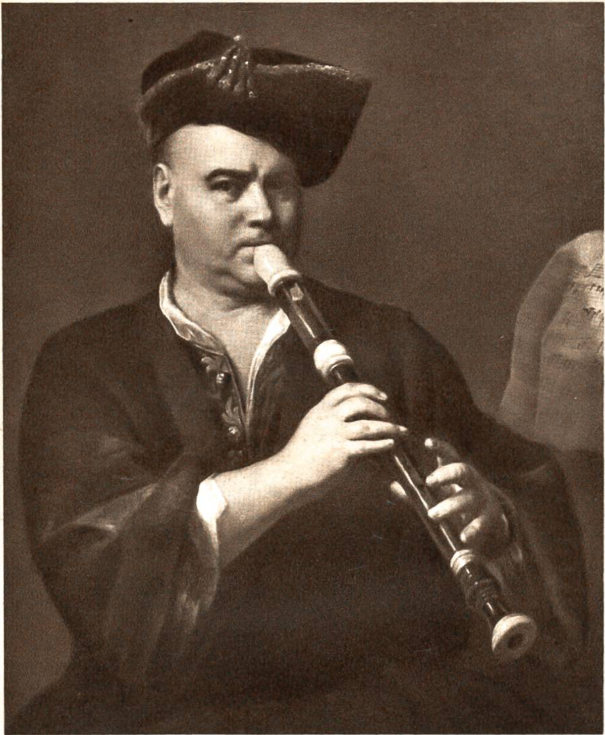
Flötenspieler, von János Kupetzky, aus Böhmen, 1667-1740.