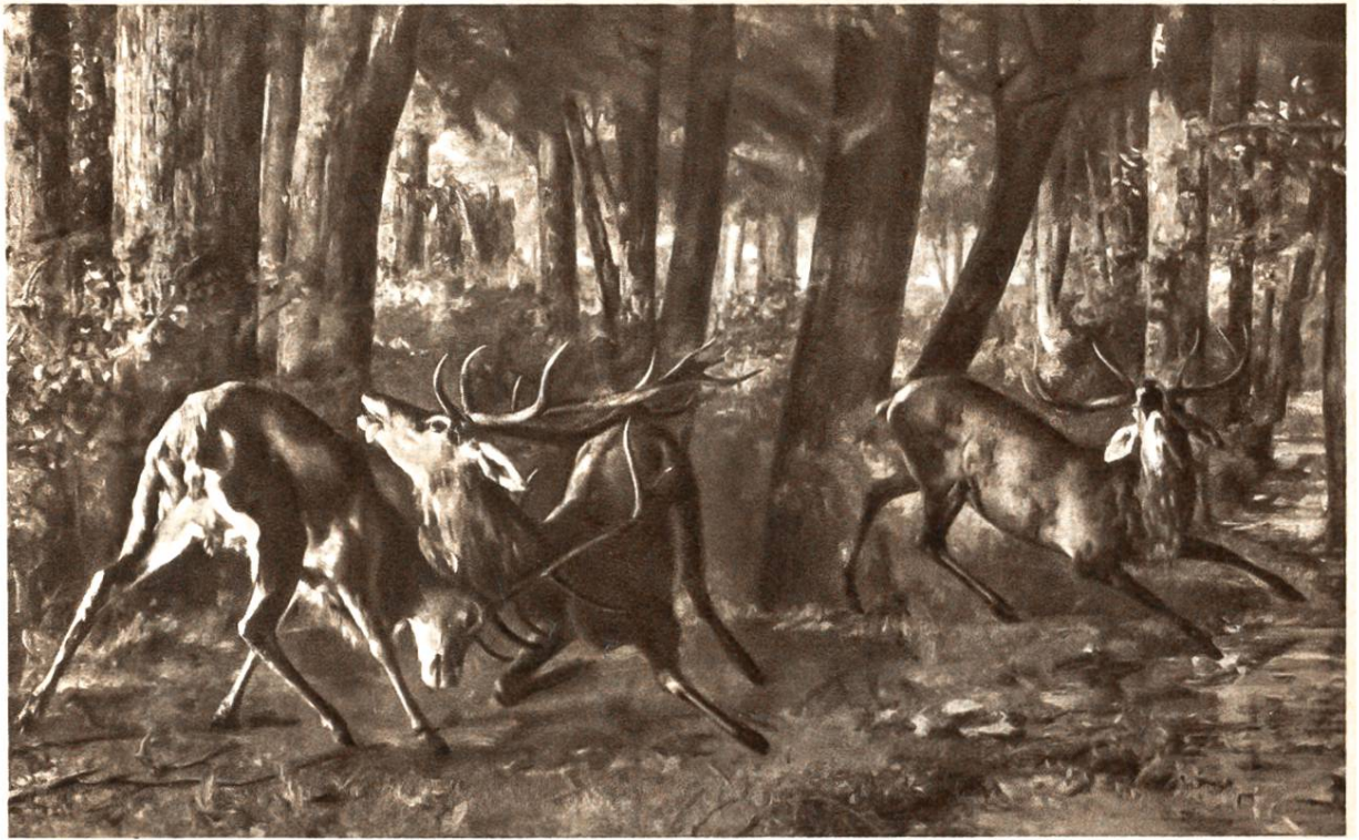
Kämpfende Hirsche, von Gustave Courbet, Paris, 1819-1877.