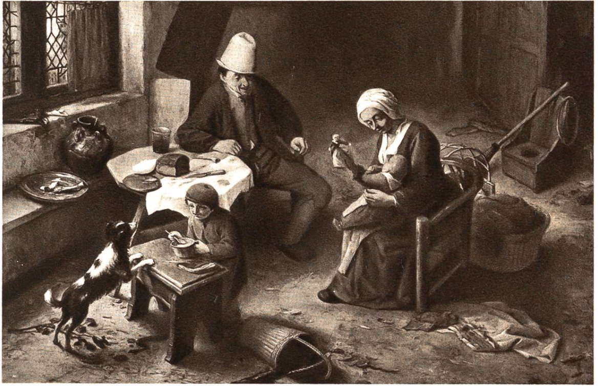
Holländische Familie, von Adriaen van Ostade, Haarlem, 1610-1685.