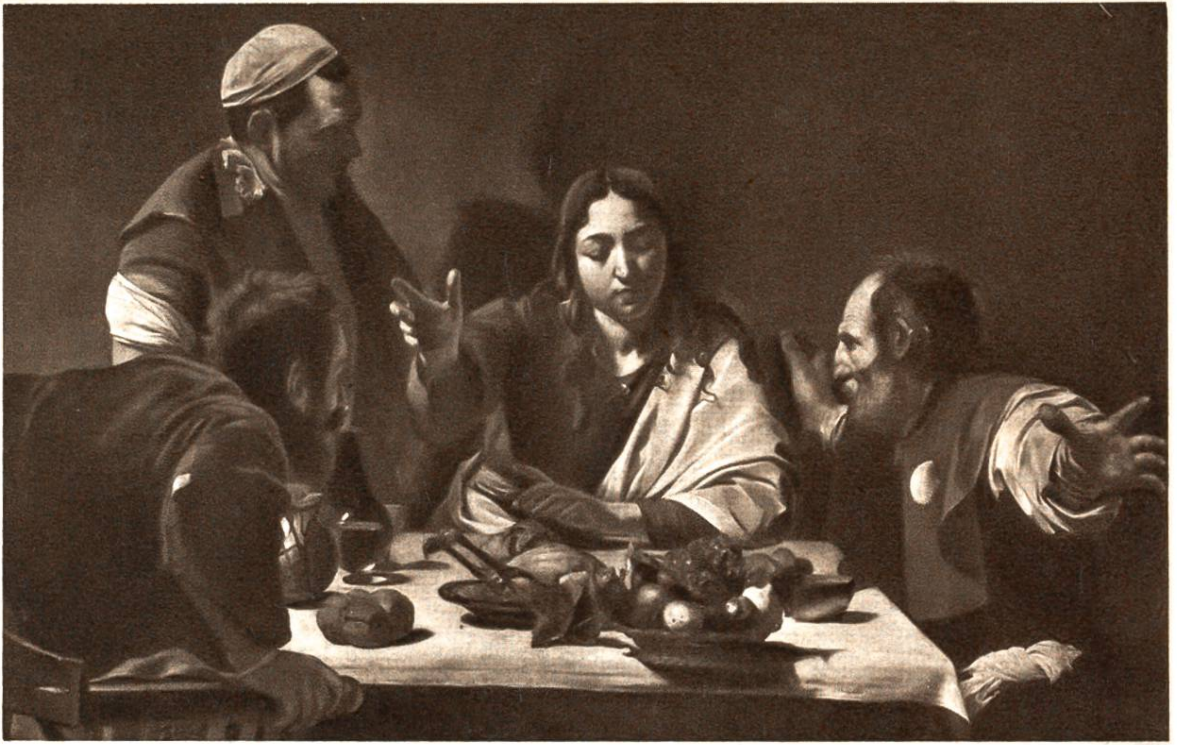
Christus in Emmaus, von Michelangelo da Caravaggio, Rom, um 1560-1609.