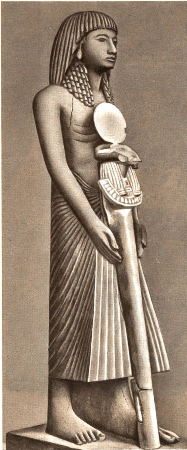
Ägyptischer Priester, Statue aus dem 14. Jahrhundert v. Chr.