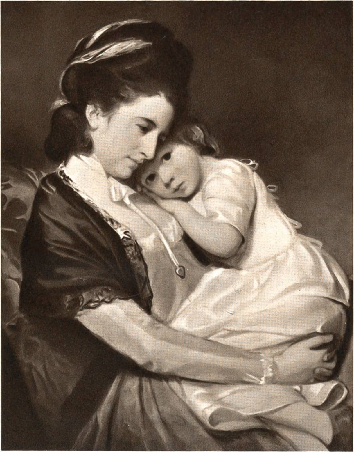
Mutter und Kind, von George Romney, London, 1734-1802.