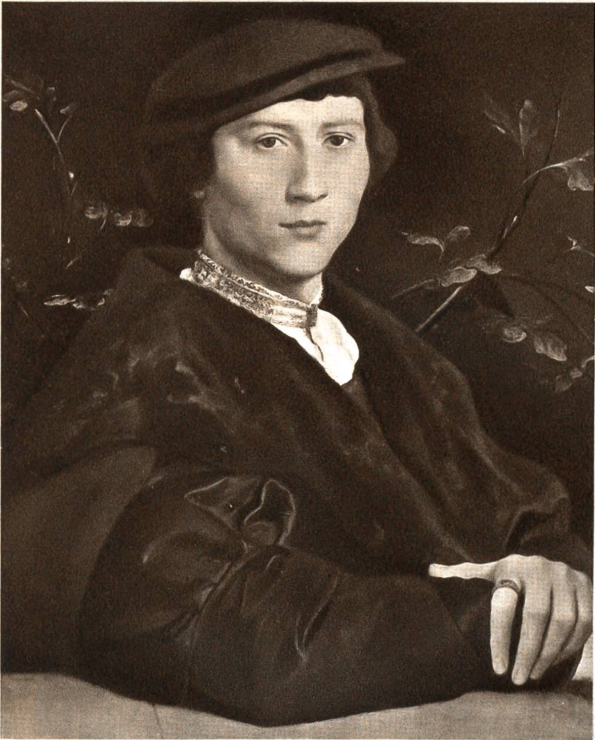
Bildnis eines jungen Engländers, von Hans Holbein d. Jg., Basel u. London, 1497-1543.