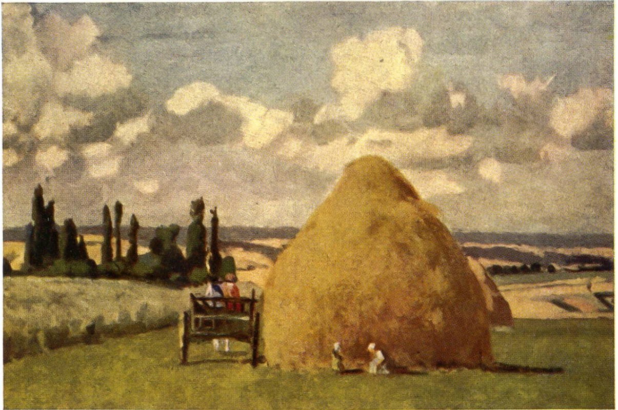
SOMMERLANDSCHAFT (Heuschober), von Camille Pissarro, Paris, 1830–1903.