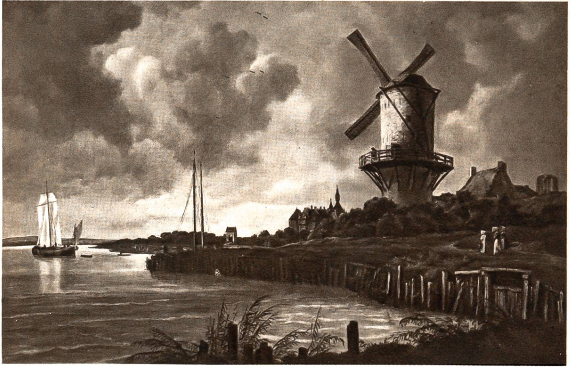
Windmühle am Rhein in Holland, von Jacob van Ruisdael, Haarlem, 1628-1682.