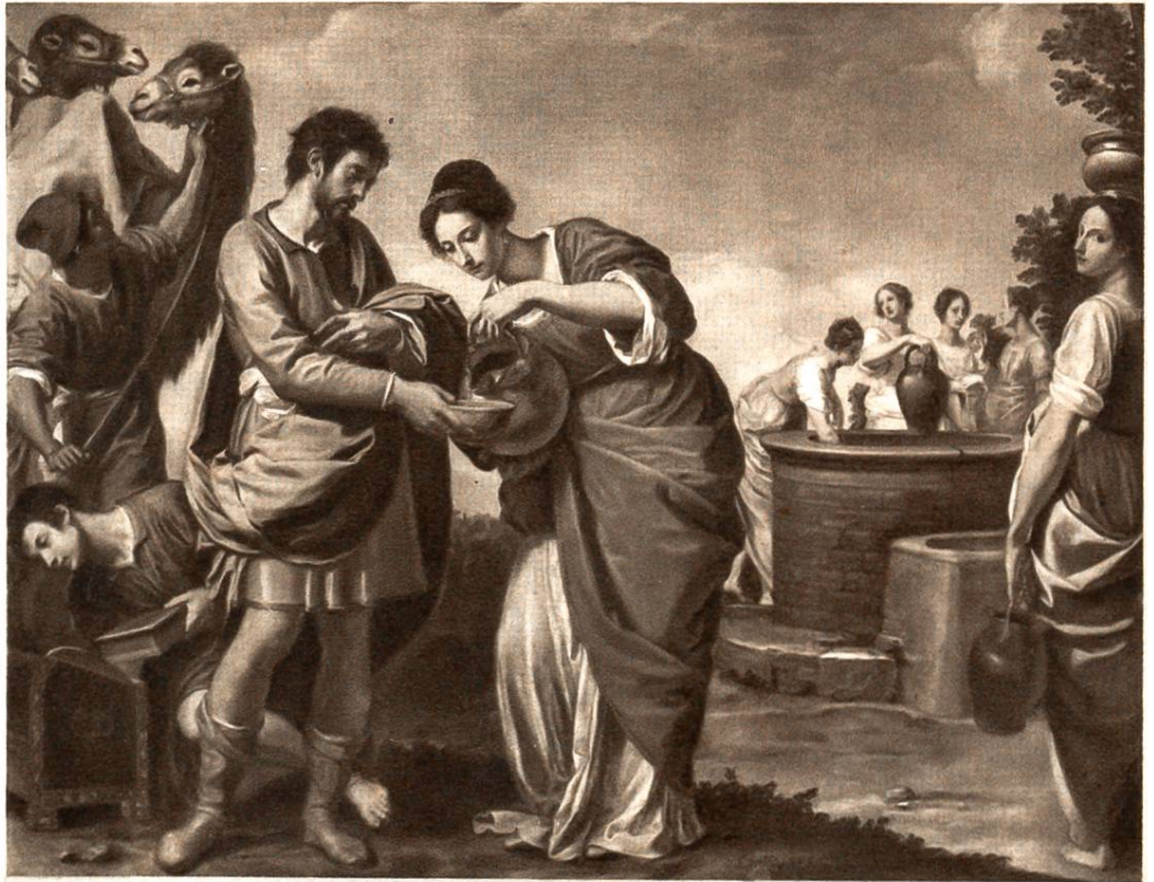
Rebekka am Brun- nen, Gemälde aus der florentinischen Schule zu Ende des 16. Jahrh.