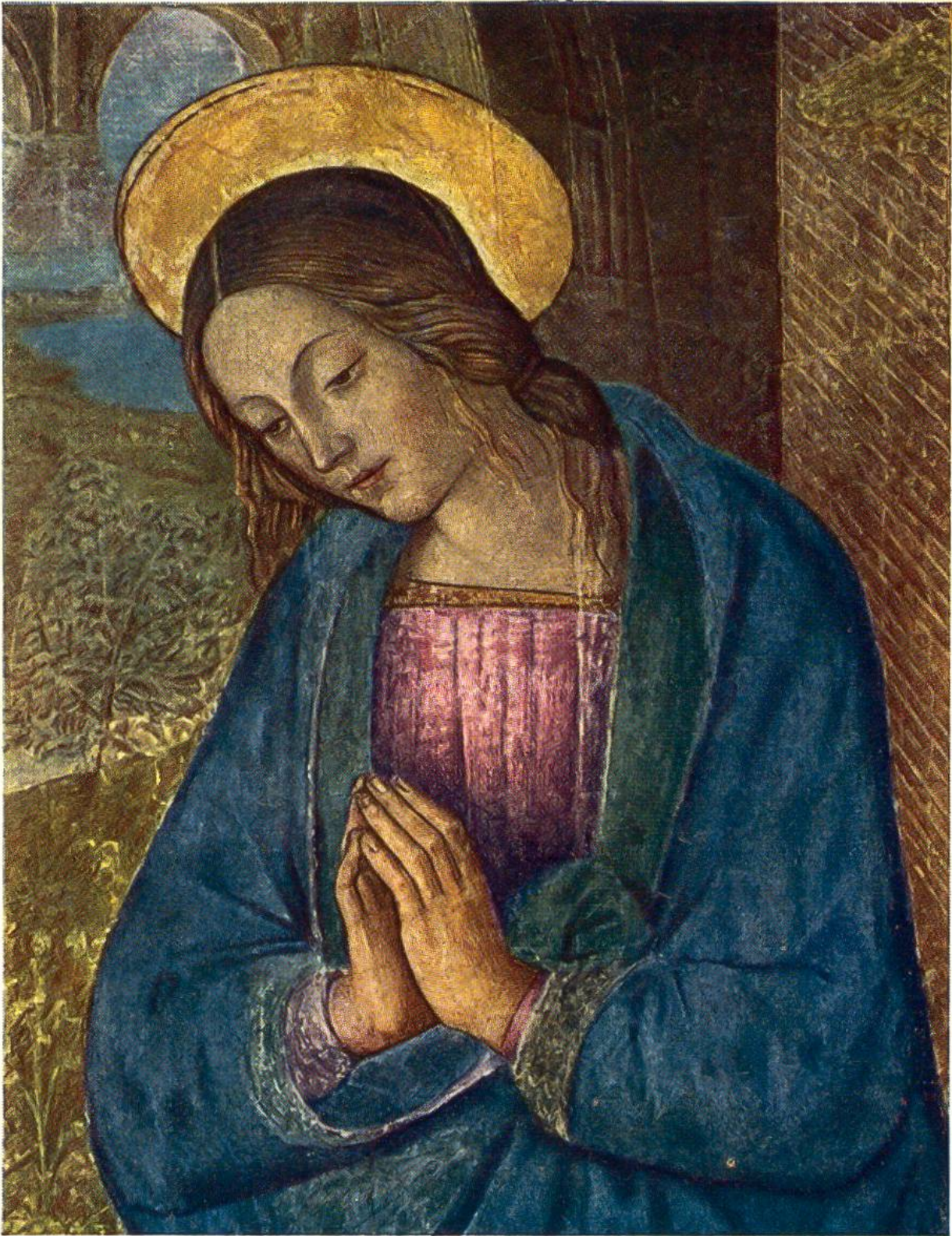
KOPF DER MARIA, aus dem Freskengemälde „Geburt Christi“ von Pinturicchio, Perugia, 1454-1513.