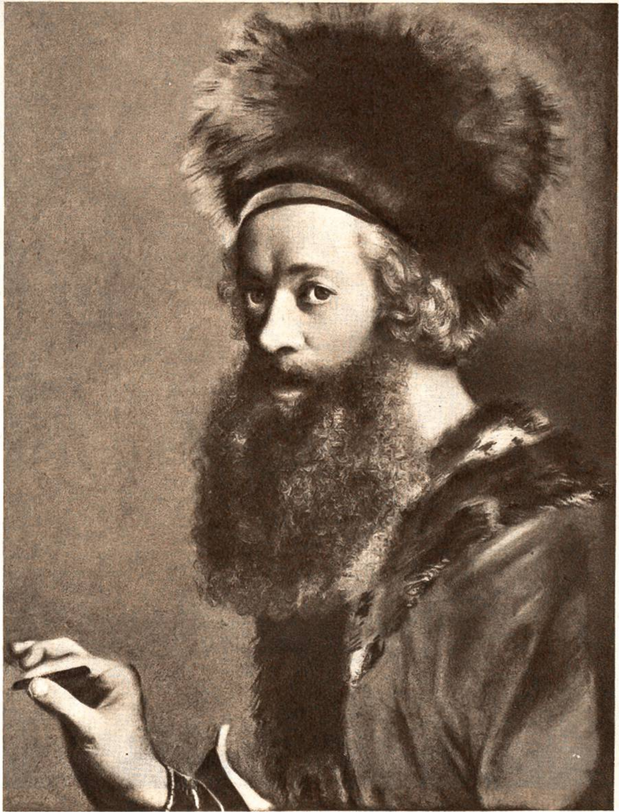
Selbstbildnis, von Jean Etienne Liotard, Genf, 1702-1789.