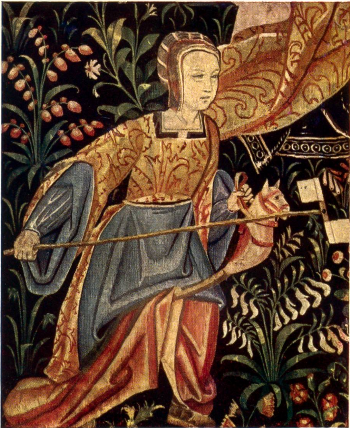
MÄDCHEN, MIT STECKENPFERD SPIELEND. Teilstück aus einem französischen Wandteppich (Gobelin) des 16. Jahrhunderts. (Verlag Pierre Cailler, Genf.)