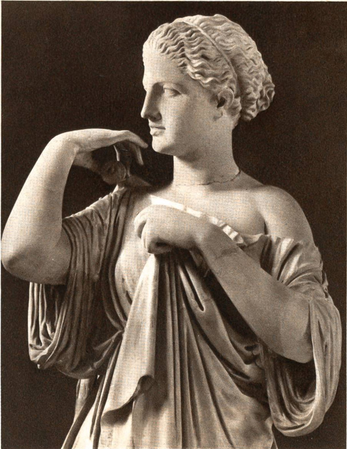
Diana, altitalische Frauengöttin. In Gabii (Prov. Perugia) gefundene Marmorstatue von Praxiteles, 4. Jahrhundert vor Chr.