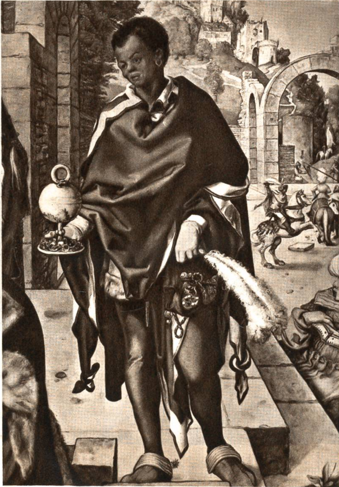
Mohrenkönig, aus der «Anbetung der Könige» von Albrecht Dürer, Nürnberg, 1471-1528.