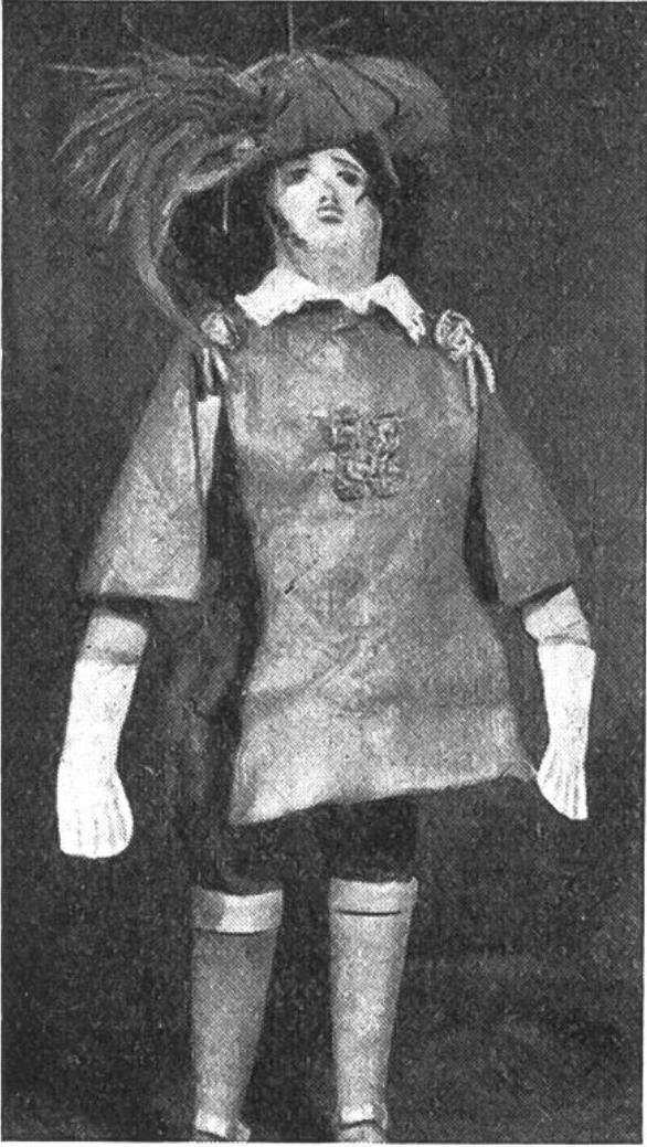
Das ist der Held des Stückes!

Ein besonderer Reiz liegt darin, die Puppen herzustellen. Sie werden aus Holz geschnitzt und dann bekleidet, haben bewegliche Glieder und meist einen ausgesprochenen Charakterkopf. Da der Gesichtsausdruck, im Gegensatz zum alltäglichen Leben, nie wechselt, wirkt die Darstellung allein durch die Bewegung der Glieder um so rührender und stärker.