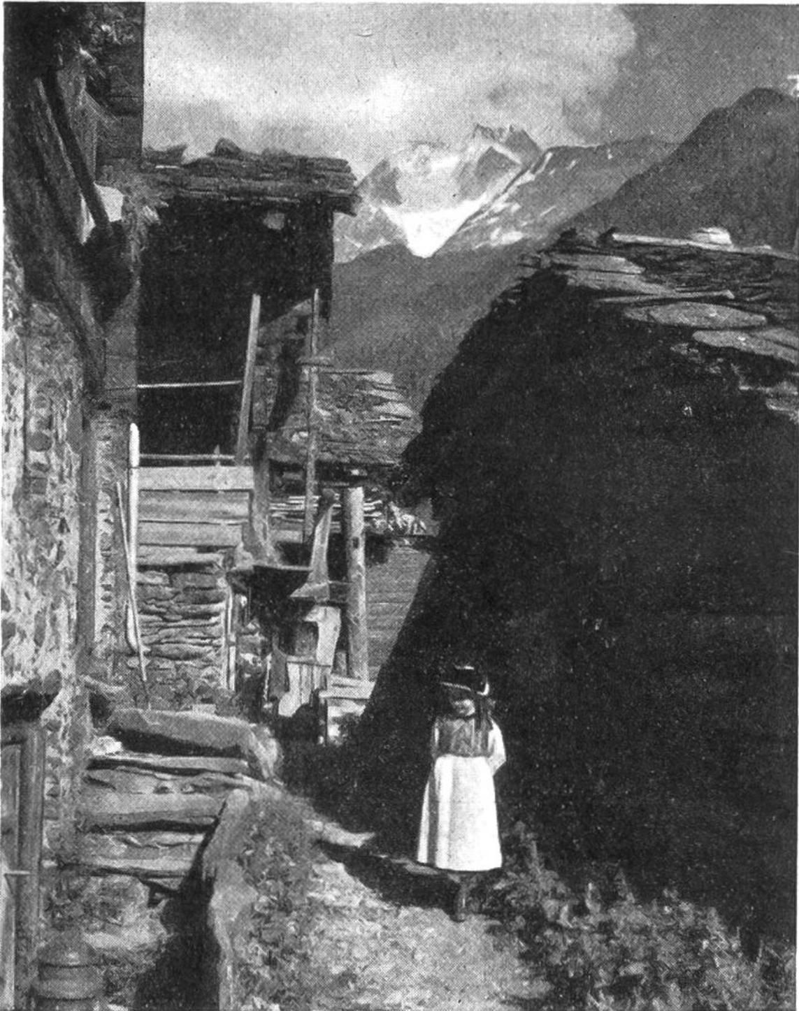
Häuser und Berge im Gleichgewicht (Bietschhorn zwischen den Hausgiebeln). Mädchen vor der dunkeln Hauswand, wo es hell hervortritt.

nügend Abstand ein, damit deine „Opfer“ auf dem Bilde weder den Kopf noch die Füße verlieren. Verlass dich nicht auf den äussersten Rand im kleinen Spiegelsucher, gib lieber etwas Spielraum. Unterlass Kopfstudien (Nahaufnahmen) mit einer Linse gewöhnlicher Brennweite, wegen der unfehlbar sich ergebenden perspektivischen Übertreibung (Nase zu