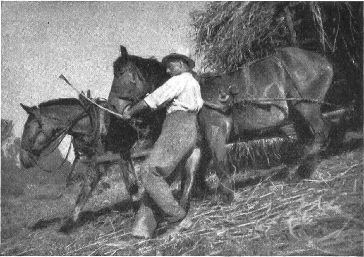
Spannung des Bildes: Zug der Rosse in der Diagonalen (mit Schwergewicht oben rechts) – kraftvolle Gegenwirkung durch das Entgegenstemmen des Mannes.

eben nichts selbstverständlich – wenn es auch nachher so aussieht. Abgesehen von den technischen Mitteln an sich, kommt es vor allem auf den Menschen an, der hinter dem Apparat steht. Fehlt diesem Menschen der Sinn für Wahrheit und Schönheit, fürs Ebenmass, fehlt ihm die künstlerische Schau und das Einfühlungsvermögen, so nützt auch der beste Apparat herzlich wenig.