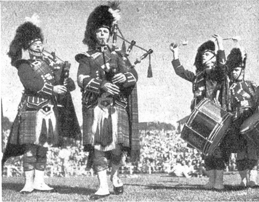
Dudelsackpfeifer in der Nationaltracht der Schotten. Die Musik wird für die Sackpfeife besonders komponiert; sie wird als aufreizend und kampflustig empfunden.

Bei den Tanzwettkämpfen spielt das schottische Nationalinstrument, die Dudelsackpfeife, zum Tanze auf. Dieses im 17. Jahrhundert auch bei uns als Sackpfeife heimische Instrument besteht aus einem vom Spieler angeblasenen, ledernen Balgsack, aus dem die durch Anpressen verdichtete Luft in zwei mit Tonlöchern versehene Schalmeiröhren strömt. Der Dudelsack besitzt noch zwei oder drei mitsummende Pfeifen, die Hummeln und Brummer, welche die Melodie begleiten. Wenn wir heute in froher Gesellschaft zuweilen noch „Schottisch“ tanzen, die Ecosaise, dann bewegen wir uns in lebhaftem Zweivierteltakt und denken nicht daran, dass dieser Tanz von einem alten schottischen Volkstanz abgeleitet ist, zu dem einst mit dem Dūdelsack aufgespielt wurde.