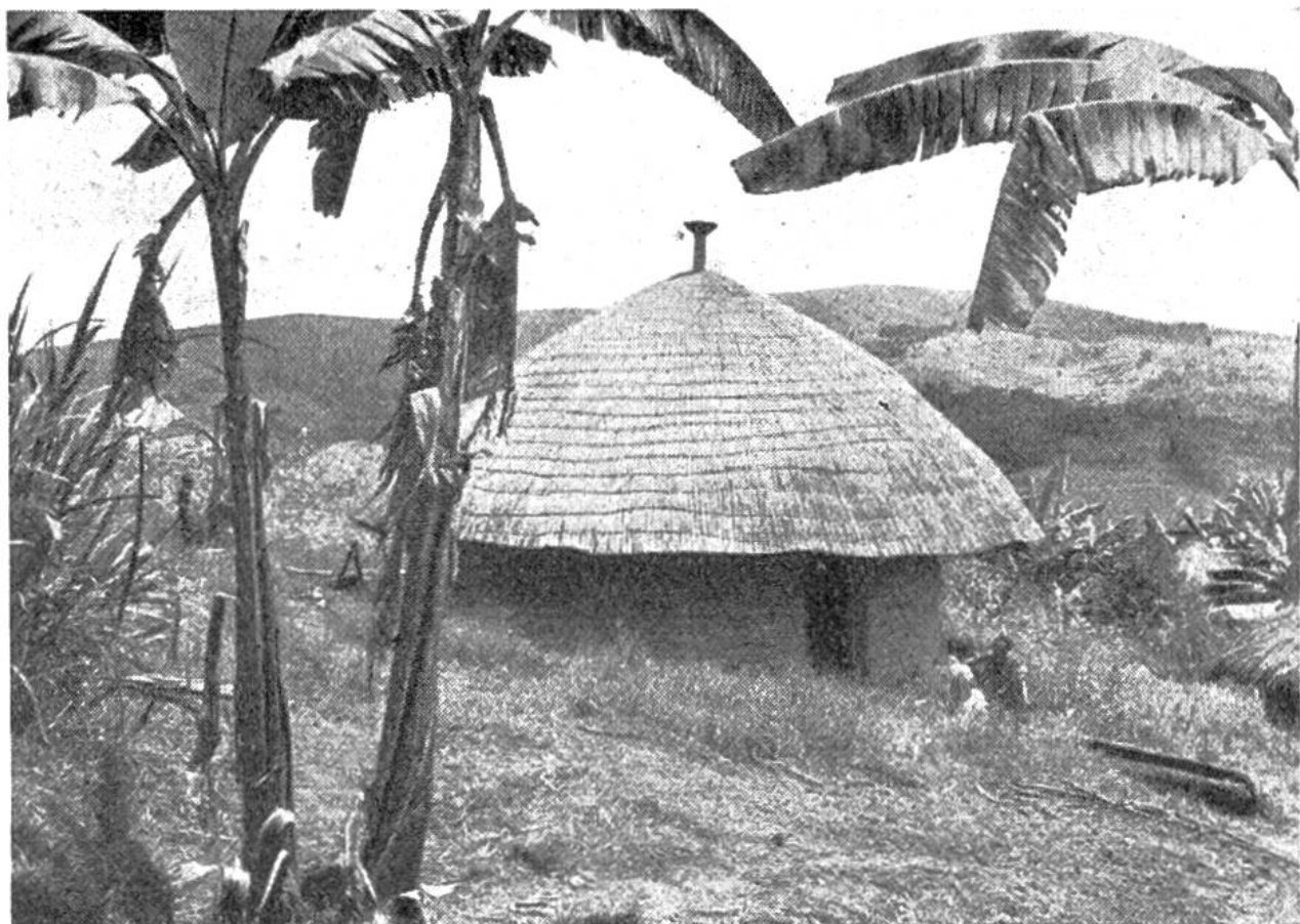
Eine aus Lehmziegeln erbaute strohbedeckte Eingeborenen-Rundhütte auf der hügeligen Hochebene von Urundi. Im Vordergrund Bananenpflanzen.

wilden, primitiven, ja fast diabolischen Tanzart hingeben. Ein Band aus Perlen hält eine Art Mähnenbusch aus weissen Reiherfedern, die über Rücken und Schultern fallen, aus dem Gesicht. Der Tanz ist packend. Eine Schlacht wird getanzt. Hohe Sprünge wechseln mit wirbelnden Bewegungen am selben Platz, die Watutsi verhalten und vertieft, die Batwa mit wilder Freude am Rhythmus. Und dieses Wilde, Primitive, Erdhafte unterstreicht in geschickter Weise die hochstehende, edle Tanzart der Pagen. Die Batwa bilden somit wunderliche Schatten, um das Licht der Herrenmenschen noch leuchtender zur Geltung zu bringen. Eine Musik, die sich innerhalb von 10 Noten bewegt, begleitet den aufregenden Tanz.