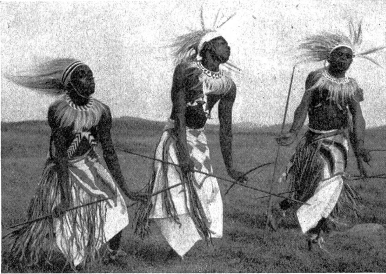
Drei der Pagen des Königs von Ruanda während einer der traditionellen Tänze, die jahrelange angestrenzte Übung erfordern.

selten brutal. Sie drangen vor ungefähr fünfhundert Jahren, aus dem Kongo kommend, in Ruanda-Urundi ein und verdrängten die dortige Urbevölkerung, die Batwa, die heute nur noch 1% der Bevölkerung ausmachen. Die Batwa sind hässlich, untersetzt, doch sind sie tapfer, verstehen sich zu wehren und lieben die Unabhängigkeit. Sie sind Jäger, werden aber auch an den Königshof gezogen, wo sie als Tänzer oder Wächter eingesetzt werden. Als Tänzer? Solch hässliche Menschen? Wir werden später vernehmen, weshalb.