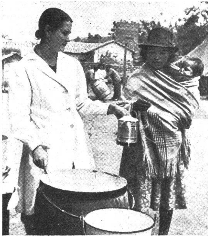
Auch in Equador wird von der Unicef Milch verteilt.