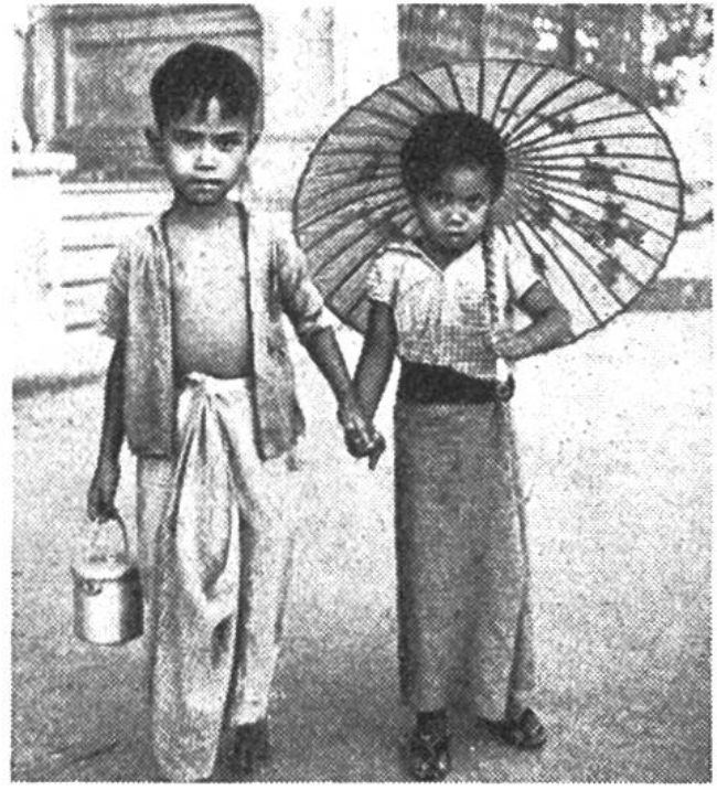
Ein burmesisches Geschwisterpaar holt seine Milchration ab.

den Nationen durch Unterstützung der Informations- und Pressedienste; Förderung des Elementarunterrichtes und der Verbreitung der Kultur im allgemeinen; Mithilfe zur Erhaltung, Weiterentwicklung und Verbreitung des Wissens.