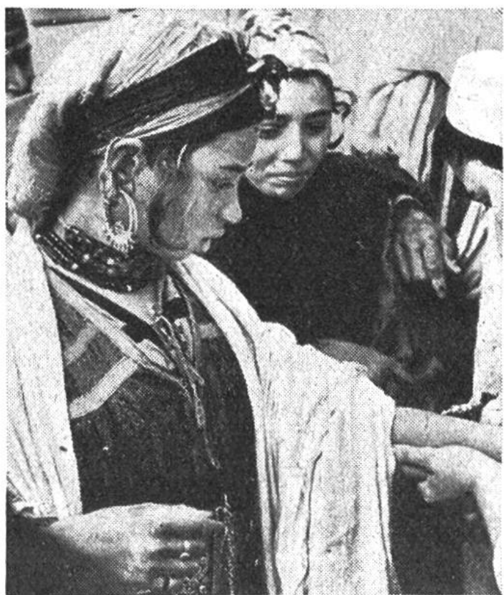
Oben sucht eine jugoslawische Mutter bei einer Unicef-Kinderschwester Rat. Unten wird eine junge Algerierin gegen Tuberkulose geimpft.

Erde zerstreuten Länder entgegen. In 14 europäischen, 18 asiatischen, 18 südamerikanischen und 11 Ländern des Nahen Ostens wurden Millionen und Millionen Franken ausgegeben – auch die Schweiz hat bei den Spenden wesentlich mitgeholfen –, um den bedürftigen Kindern zu helfen. Doch auch die Zahl der zu betreuenden Kinder geht in die Millionen!