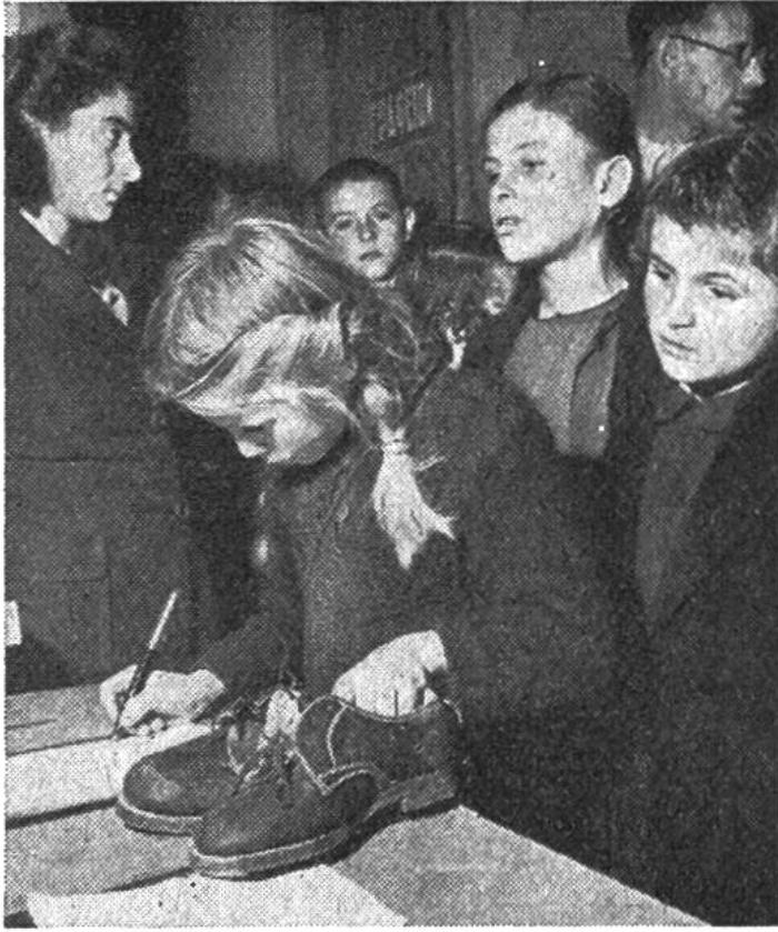
Den Empfang von einem Paar Schuhe zu bescheinigen, ist für die kleine Griechin ein grosses Ereignis.

zu leiden haben. Ansteckende Krankheiten, Malaria, Tuberkulose müssen bekämpft werden, und viel Geld wird für Anschaffungen von medizinischen Instrumenten, Röntgenapparaten, Thermometern, Ambulanzen und anderen Gerätschaften ausgegeben. Diese Beträge stehen nicht weit hinter den für Nahrungsmittel aufgewendeten zurück. Auch gibt es Bekleidungs- und Unterkunftssorgen. Ihnen versucht man durch Verteilen von Kleidern