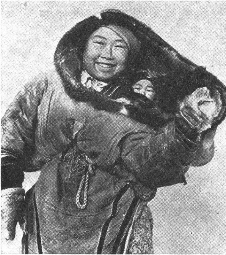
Junge Eskimo-Mutter mit ihrem Kind.

in rohem und gefrorenem, nur gelegentlich in angekochtem Zustand verzehrt. Anders verhält es sich in den Übergangszeiten und im Sommer: da unterhalten die kanadischen Eskimos kleine Feuer aus mühsam zusammengesuchtem Heidekraut und Reisig. Zu dieser Zeit leben sie in Zelten, die ursprünglich stets aus Rentierfellen bestanden, während heute auch solche