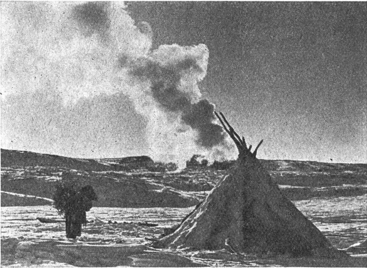
Zelt aus einem Stangengerüst und darübergerlegten Rentierfellen. Davor eine Frau, die mit einem Bündel Reisig und Heidekraut zum Feuere zurückkehrt.