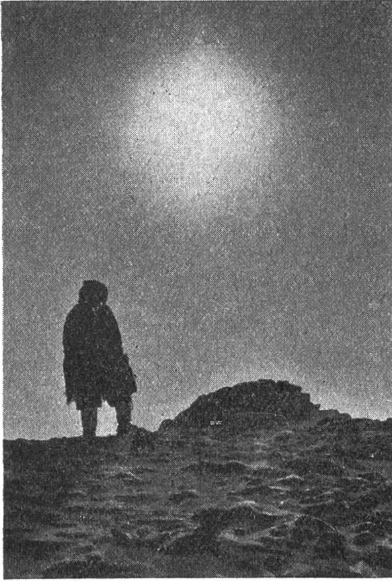
Eskimo vor einem einsamen Grab - einem Steinhaufen in der Tundra.

Tätigkeit der Königlich Kanadischen Polizei zu sein; denn die Rechtsvorstellungen der Eskimos sind anders als die kanadisch-europäischen, so dass die Eingeborenen manchmal für Handlungen bestraft werden, die sie nicht als Verbrechen ansehen. Dagegen sind die Bemühungen der Regierung im Gesundheitsdienst, zu welchem auch Flugzeuge eingesetzt werden, eine wahre Wohltat. Es ist zu hoffen, dass das kleine Volk der kanadischen Eskimos, das sein entbehrungsrei-