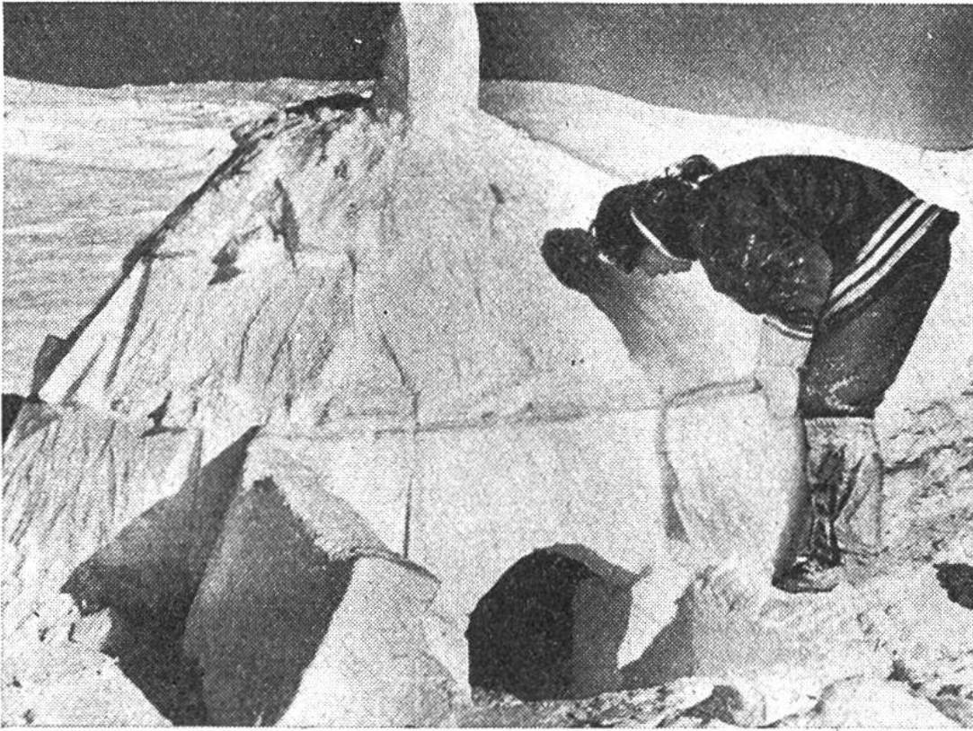
Das aus Schneeböcken errichtete Iglu stellt die Winterwohnung der kanadischen Eskimos dar.

rakteristische Lebensweise an der Meeresküste als Jäger der grossen Seesäugetiere Seehund, Walross und Wal nicht oder nur in sehr geringem Masse kennen: bis vor nicht allzu langer Zeit lebten sie ausschliesslich als Rentierjäger im Inland; erst spät stiessen Teile der Bevölkerung zur Küste vor.