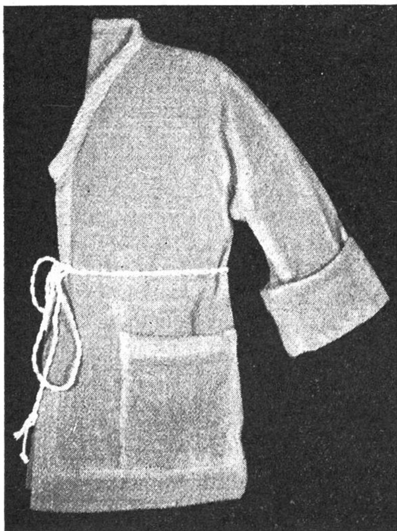
Bademantel mit Kimono-Ärmeln.

M., 25 \times 1 M. abkehren. Es bleiben 24 M., 1 cm hoch gerade stricken. Beim Erhöhen des Hinterteils 6 \times 7 M. abkehren.