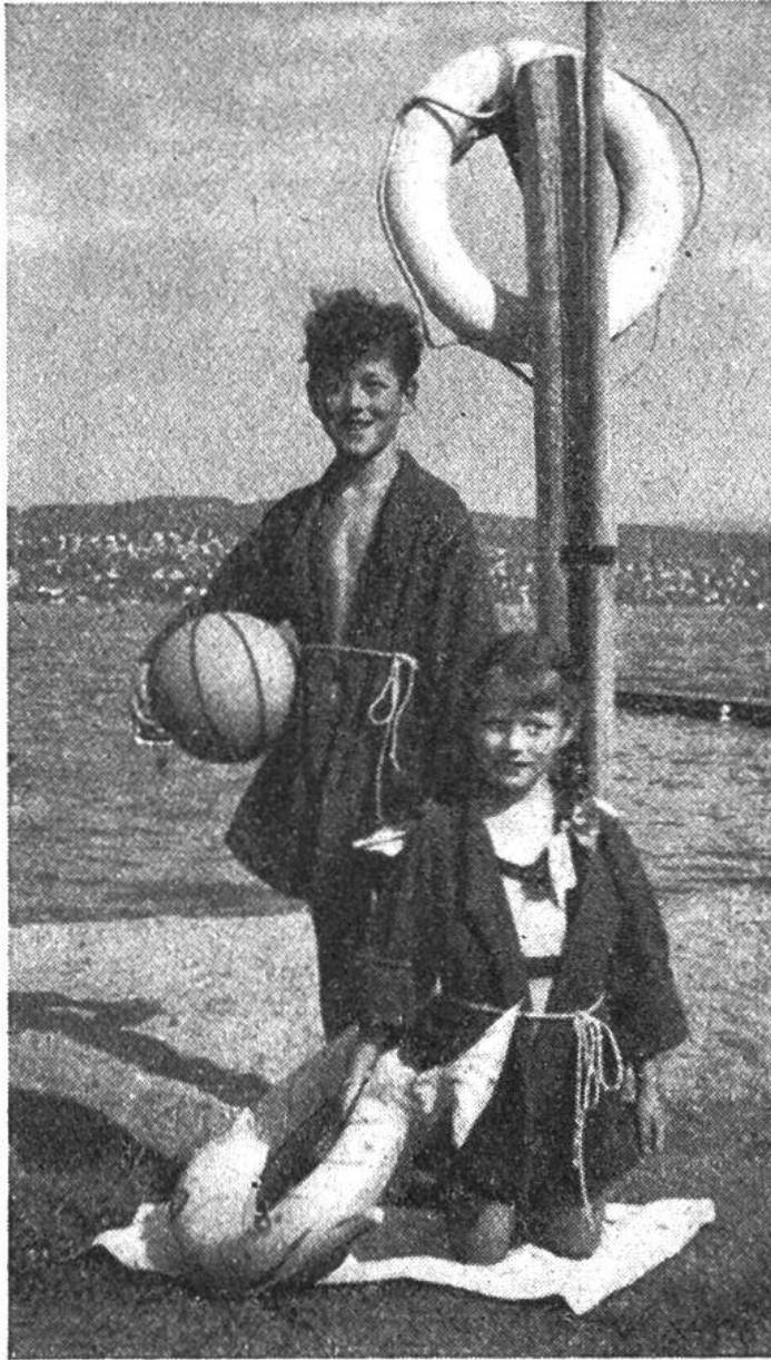
Nach dem fröhlichen Spiel im Wasser schlüpfen sie gern in ihre hübschen Bademäntel.

Während der kleinere Mädchenmantel einen Kimonoschnitt mit Ärmelspickel aufweist, ist der Knabenmantel in gerader Form mit eingesetzten Ärmeln geschnitten. Beide Arten haben vorn einen breiten Übertritt, damit die Vorderteile weit übereinandergehen.