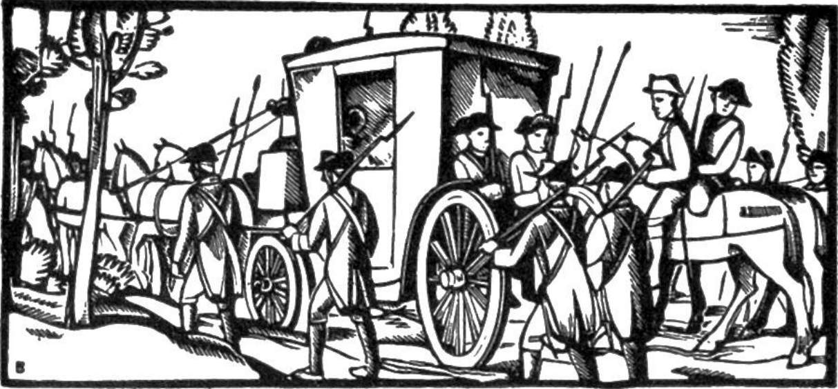
Ludwig XVI. wurde auf der Flucht in Varennes gefangengenommen und mit seiner Familie nach Paris zurückgeführt (1792).