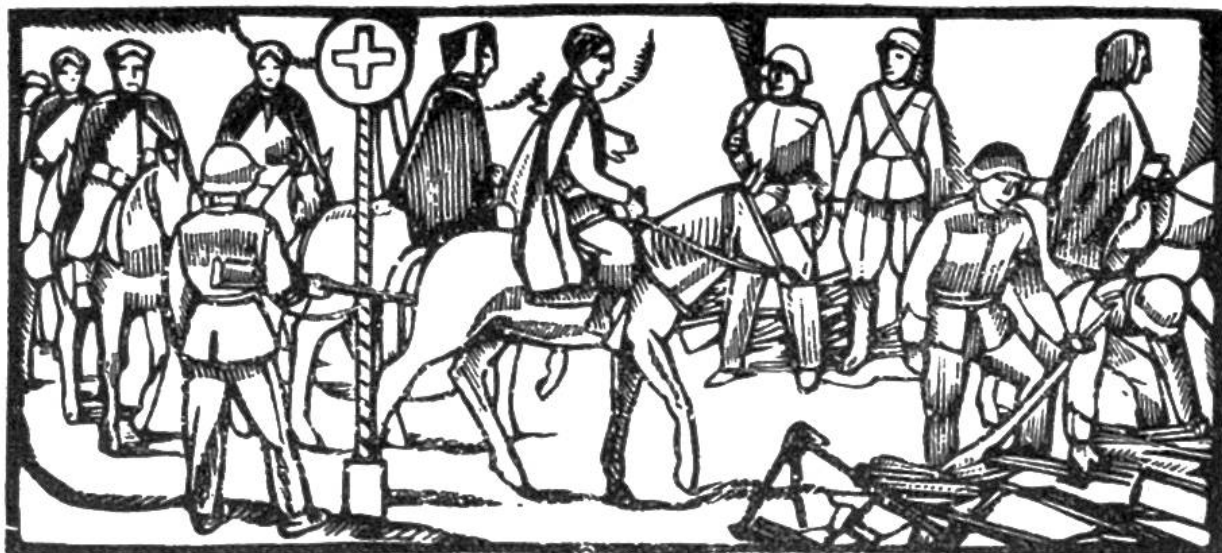
Im Juni 1940 überschreiten nahezu 40000 alliierte Truppen die Schweizer Grenze. Waffenabgabe der Spahis im Berner Jura.