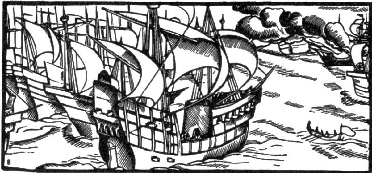
Die Engländer besiegen die mächtige spanische Flotte Armada, 1588.