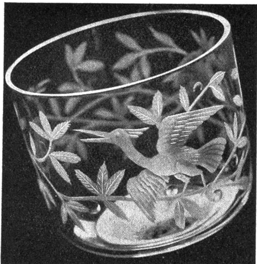
Schale mit Vögeln und Zweigen, 1938 gezeichnet und geschliffen von Jakob Werner.

ken, in Stadt und Land bei uns wieder auf und damit auch die edle Kunst des Glasschleifens. J. A.