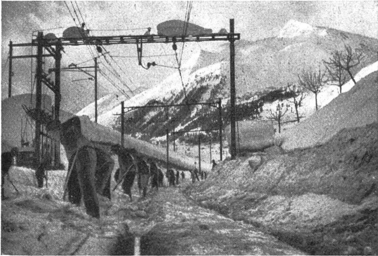
Nach ergiebigem Schneefall legen lange Kolonnen von Arbeitern die Geleise frei.

waldungen verhindert. Dies kostet aber sehr viel Geld. Aus Spargründen begnügt man sich oft mit der Erstellung von Schutzgalerien, sofern nicht auch Wohngebiete zu sichern sind.