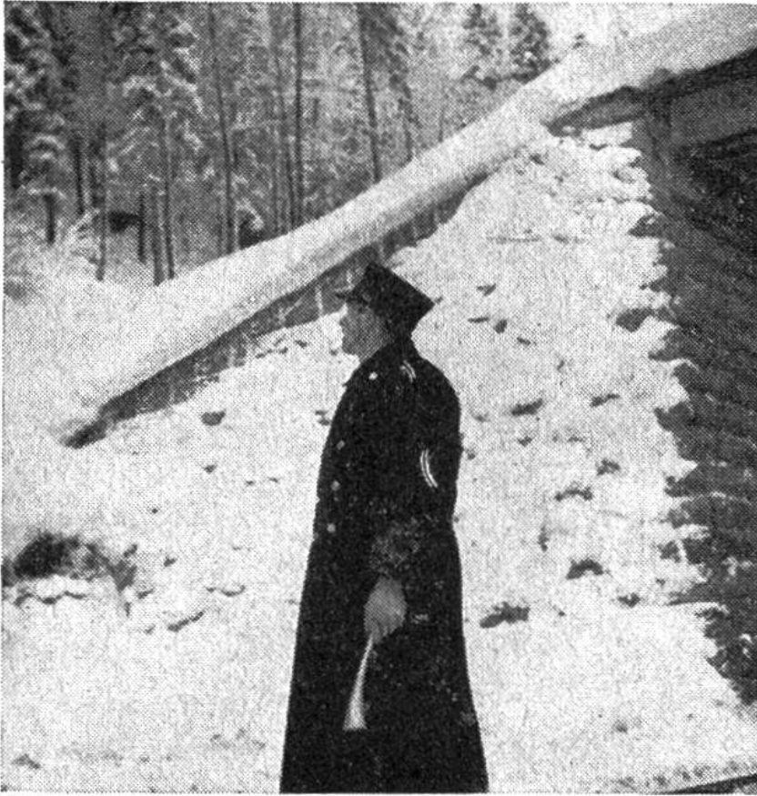
Bei drohender Lawinengefahr überwachen einsatzbereite Eisenbahner die unsicheren Hänge; nötigenfalls halten sie herannahende Züge auf.

Kleinschleudern besorgt, von denen jede mit einem einzigen Bedienungsmann die Arbeit von ca. 30 Schneeschauflern bewältigen kann. Diese Maschinen werden praktisch nur auf den Gebirgsstrecken benötigt.