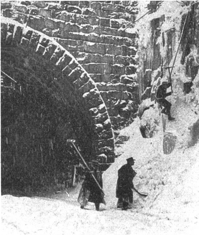
An einem Seil hängend, pickelt ein mutiger Eisenbahner gefährliche Eispartien ab.

ler (Traxes) und Muldenkipper (Dumpers) gemietet. Ferner sind zahlreiche Hilfsarbeiter erforderlich, die von einheimischen Baufirmen nach einem vorsorglicherweise bereitliegenden genauen Alarm- und Transportplan teilweise aus abgelegenen Gebirgstälern herbeigeholt werden. Oft müssen diese Arbeiter schon bei grossem Schneefall ohne Lawinenniedergänge gerufen werden, was ihnen willkommenen Verdienst in den Wintermonaten bietet. Im Januar und Februar 1951 wurden allein längs der Gotthardlinie bis zu 500 zusätzliche Arbeitskräfte für die Schneeräumung eingesetzt.