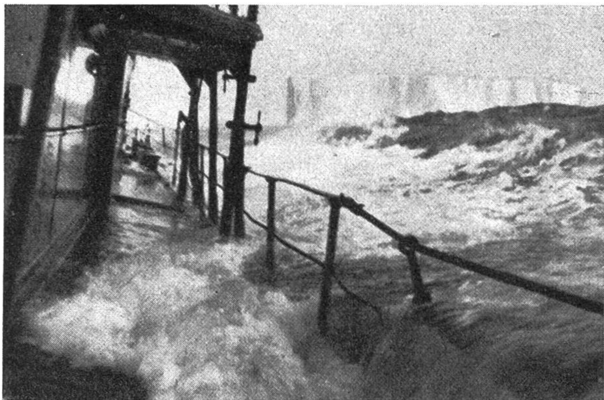
Zwei Gefahren: im Vordergrund das stürmische Meer, im Hintergrund der drohende Eisberg.

Luftwirbel befindet, welcher die gewaltigsten Wassermengen bis in Wolkenhöhe reisst.