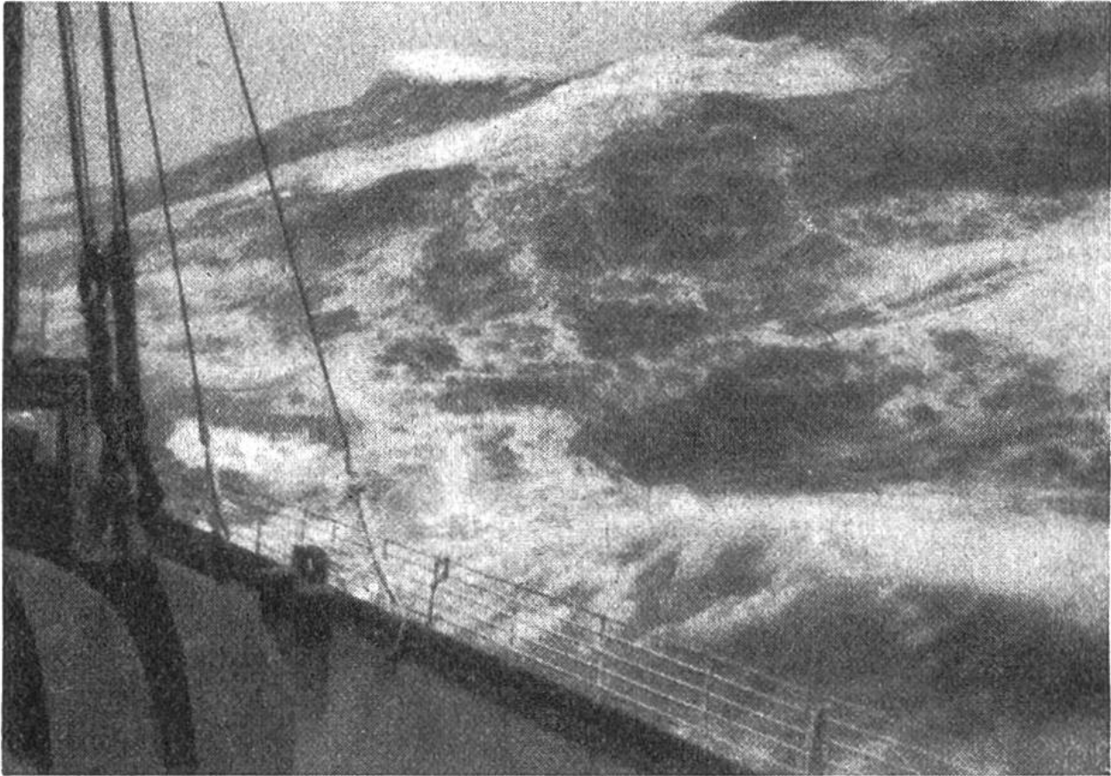
Mauern von stürmischen Wogen umschliessen das Schiff in der Einsamkeit des unendlichen Meeres.

terstürme 10–15 m Höhe bei 150–200 m Länge der Wellen zu erreichen; im allgemeinen jedoch sind Wellen von mehr als 7 m Höhe sehr selten.