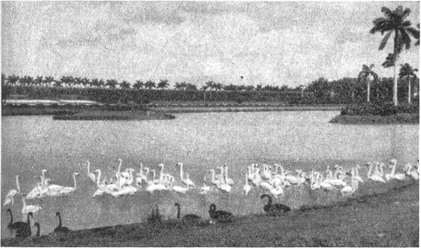
Die herrliche Flamingo-Kolonie bei Miami in Florida.

Flamingos haben normalerweise eine Bluttemperatur, welche unserer höchsten Fiebertemperatur gleichkommt, nämlich etwa 42^{\circ} C. Sie sind imstande, erhebliche Kälte – weit unter dem Gefrierpunkt – zu ertragen; bloss darf sich auf ihrem Badewasser, in welchem sie ihre dünnen Schwimmhäute vor dem Erfrieren schützen müssen, keine Eisschicht bilden, weil sie sich an deren scharfen Bruchstellen leicht die dünnen Beine verletzen und anschliessend oft Infektionen erleiden.