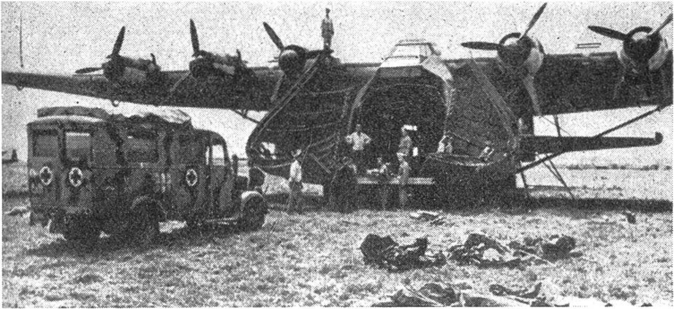
Moderner Transport von Kriegsverwundeten mit Ambulanzen und Grossraumflugzeug.

besserung des Loses der Verwundeten und Kranken der Heere im Felde, zur Verbesserung des Loses der Verwundeten, Kranken und Schiffbrüchigen der bewaffneten Kräfte zur See, über die Behandlung der Kriegsgefangenen und über den Schutz der Zivilpersonen in Kriegszeiten – den Erfahrungen im Koreakrieg und den mutmasslichen Kriegsmitteln eines künftigen Krieges entsprechend schon wieder erweitert werden. Denn die Zerstörungen gehen immer dem Heilen voraus. So wird das Rote Kreuz sein Ziel wohl erst dann erreicht haben, wenn es auf der Erde keine Kriege mehr gibt.