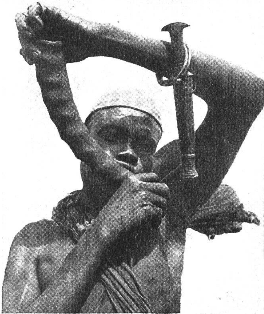
Von den Negern Kameruns wird die Kirdi-Trompete geblasen, wobei mit der Handfläche über der grossen Öffnung des Horns der Ton nach der gewünschten Höhe abgeändert werden kann.

tall, die es auf der weiten Welt gibt, ist Legion. Aus einigen Rohrpfifen von verschiedener Länge, die sie aneinanderklebten, verfertigten die Hirten in frühesten Zeiten (wie heute noch die Gauchos in Südamerika) die Panflöte. Sie ist in unserem Kulturkreis fast vergessen; aber eines der wundervollsten Musikstücke der Welt erklingt heute noch auf diesem Instrument: Papageno spielt in Mozarts «Zauberflöte» darauf. Die Querflöte mit ihren reinen Tönen und hohen Vogeltrillern wird quer an den Mund gehalten. Sie fehlt in keinem Orchester. Zusammen mit den Wirbeln und Schlägen der Trommel ergibt das schrille Pfeifen der Kleinen Querflöte, der Piccolo-Flöte, wie sie auch genannt wird, eine flotte Marschmusik. Oboe, Englischhorn, Klarinette und Fagott sitzen im Orchester nebeneinander. Die Oboe klingt klar und hell, anmutig und doch spitzer als ihre weicheren, drolligen und zuweilen elsternhaft geschwätzigen Schwestern, die Klarinette und das