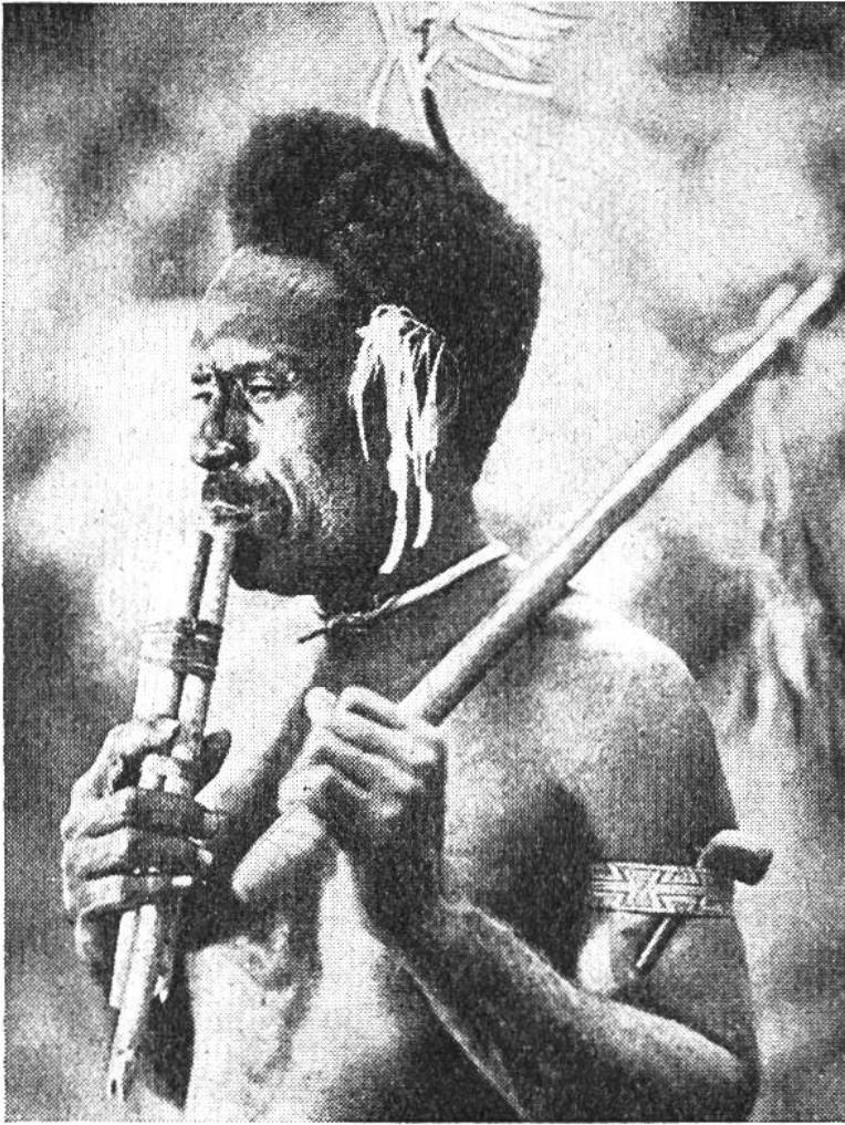
Ein Nasioi-Insulaner der nördlichen Salomon-Inseln im Fest- und Tanzschmuck. Die Rechte hält eine Bocksflöte, auf der er zum Tanz aufspielen wird. Mangels Taschen hat er seine Rauchpfeife in den Armreif gesteckt.

Zupfinstrumente der primitiven Völker gehören hierher. Zur Zeit der Renaissance war die Laute bei Musikfreunden so beliebt und für das Musikleben so bedeutungsvoll wie bei uns das Klavier. Heute ist sie wie Gitarre, Mandoline und fast alle Zupfinstrumente zum Haus- und Familieninstrument geworden, und man vernimmt ihre vollen Klänge selten im Konzertsaal. Die Harfe, deren Akkorden wir bei der Aufführung der grossen Oper ergriffen lauschen, ist eines der ältesten Instrumente. Zum Klang der Harfe sang König David seine Psalmen, feierten die Ägypter und die Römer ihre Feste, und die Minnesänger des Mittelalters begleiteten ihre Weisen auf der kleinen Harfe, wie die bildlichen Darstellungen des berühmten Sängerkriegs auf der Wartburg bezeugen. Die altgriechische Lyra, die in der Bauart einfache, kleine Kitharis, von der wir nicht mehr wissen, wie sie klang, ist zum Sinnbild der holden Kunst der Frau Musica geworden.