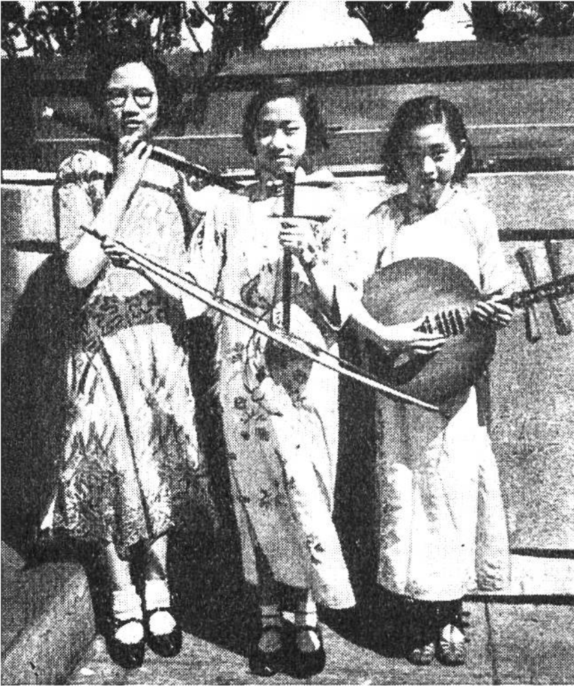
Japanische Mädchen spielen ein Trio auf ihren heimatischen Zupf-, Streich- und Blasinstrumenten.

Musikinstrumente gibt es in Tausenden von Arten. Holz und Metall, Knochen und Horn, Muscheln und Glas, Fell und Pergament sind die bevorzugten klingenden Stoffe, aus denen sie seit alters hergestellt sind. Der Mensch bringt sie durch Schlagen und Zupfen, Streichen und Reiben, Tasten und Blasen zum Schallen und Tönen.