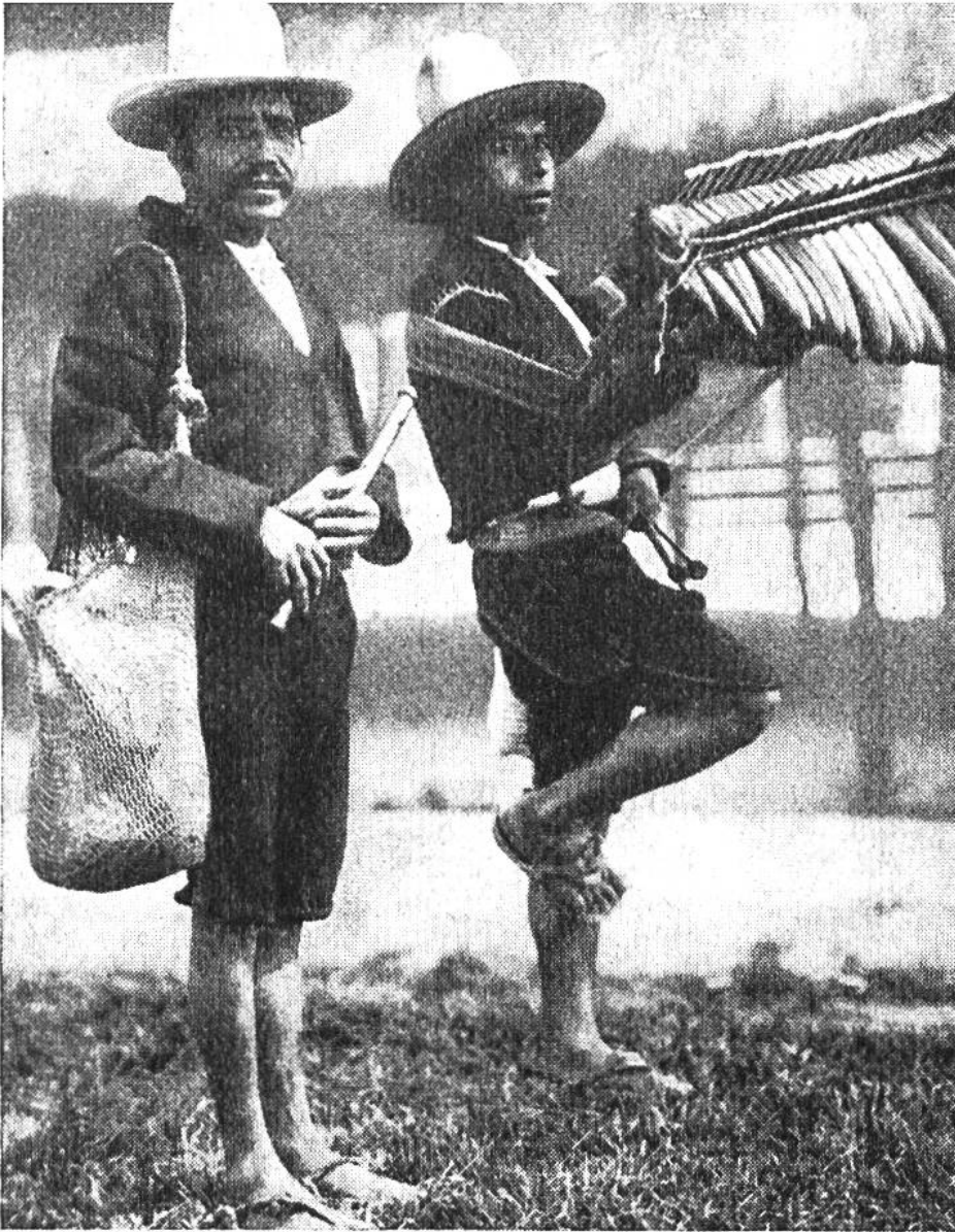
Zwei Musikanten aus Guatemala

in Mittelamerika. Ihre Instrumente sind denkbar primitiv, die kleine Maramba und die einfache Holzpfeife – aber sie tönen und klingen.