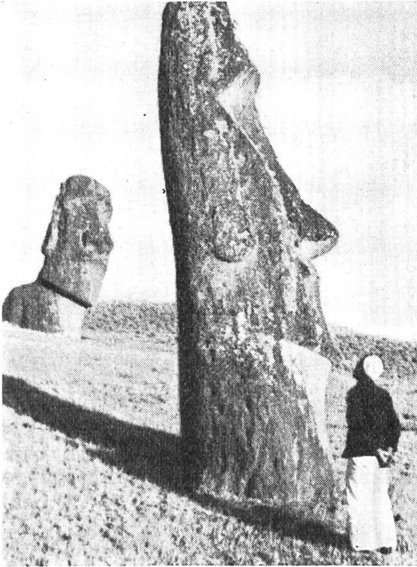
Zwei der riesigen Mohais am Krater- abhang. Die Bild- werke sind mit Steinwerkzeugen aus dem vulkani- schen Gestein ge- hauen worden.

gewesen sein muss, davon zeugen auch aufgefundene Schriftstücke auf Holz und Stein. Doch ist es noch nicht gelungen, diese Bilderschrift restlos zu entziffern.