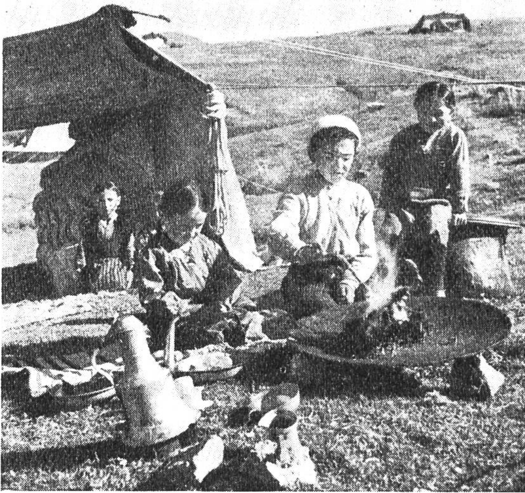
Die Jungmannschaft ist beim Kochen. Auf einem Kupferblech wird Feuer entfacht, um die Kaffeekanne (links) in glühende Holzkohle (oder Schafdung) setzen zu können. Nomaden trinken oft und gerne «Türkischen».

familie lebt vegetarisch, ausgenommen dann, wenn ein hoher Gast im Zelt ist. Dieser wird mehr geschätzt als irgendein Familienangehöriger. In allen Ländern Vorderasiens wird die Gastfreundschaft ungemein hochgehalten, so hoch, dass wir sie kaum noch begreifen können. Bei den türkischen Nomaden wird ein Fremder wie ein König aufgenommen! Geht und prüft diese Behauptung, vergesst aber nicht, einen kräftigen Knüttel mitzunehmen, um euch der bissigen Hirtenhunde zu erwehren, die von «Gastfreundschaft» keine Ahnung haben!