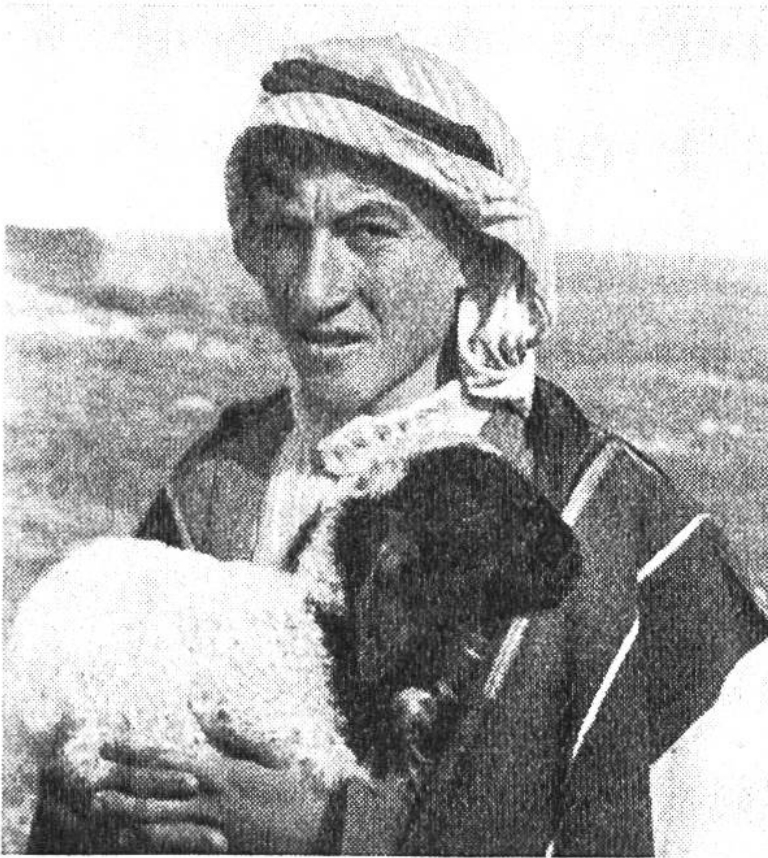
Türkischer Hirte mit einem müden Schäfchen.