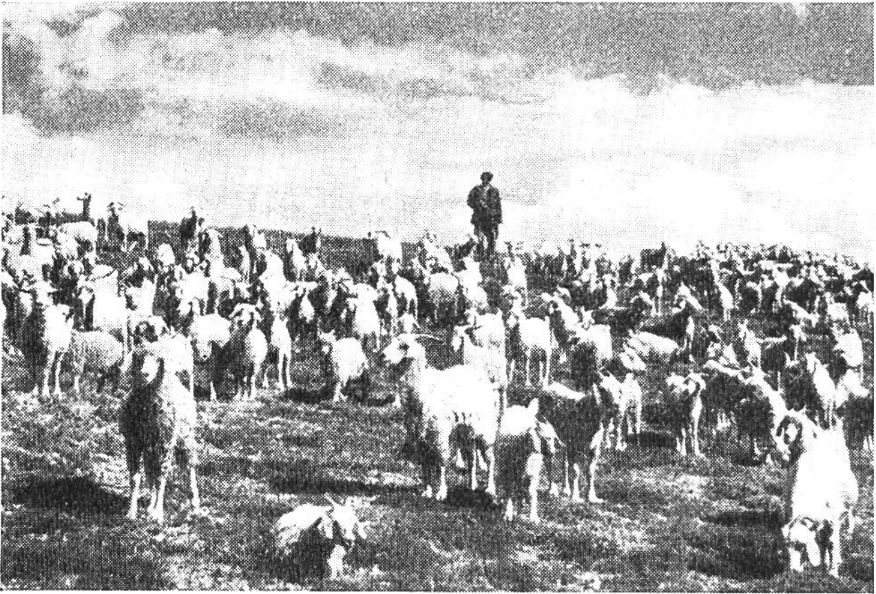
Fettschwanzschafe und Angoraziegen ziehen über die Steppen Kleinasiens hinauf in die Jailas (Maiensässen) des Taurusgebirges.

Herde ist der Wassermangel, die Dürre. Aber der Hirte kennt seinen Wanderweg sehr genau und findet auch im Hochsommer unversiegte Quellen. Die meisten Wanderwege folgen daher weniger den Bergrücken als jenen Taleinschnitten, die möglichst weit ins Gebirge zurückgreifen. Mit der Zeit bildeten sich daher auch gewisse Gewohnheitsrechte für die einzelnen Hirtensippen, die heute mehr denn je beachtet werden.