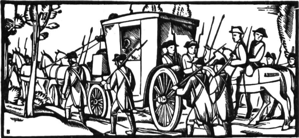
Ludwig XVI. wurde auf der Flucht in Varennes gefangengenommen und mit seiner Familie nach Paris zurückgeführt (1792).

1789–1793 Französische Revolution. 1789 Nationalversammlung, Mirabeau. 1791 bis 1792 Gesetzgebende Versammlung.