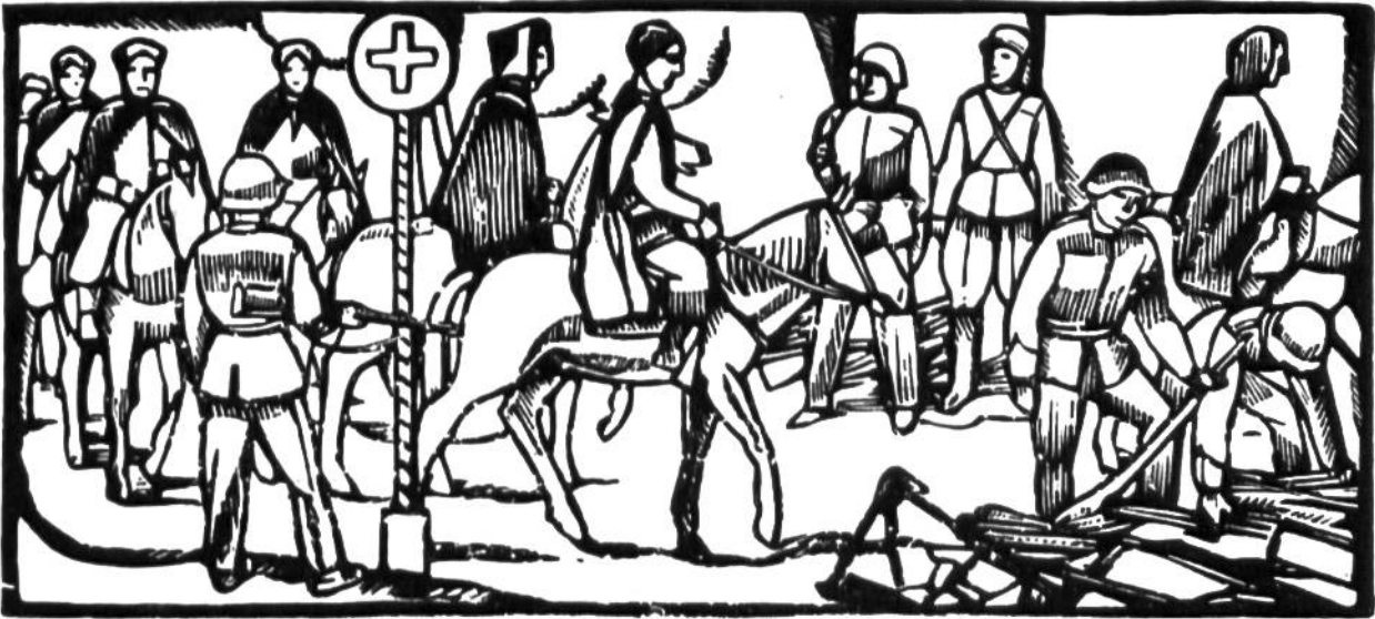
Im Juni 1940 überschreiten nahezu 40 000 alliierte Truppen die Schweizer Grenze. Waffenabgabe der Spahis im Berner Jura.