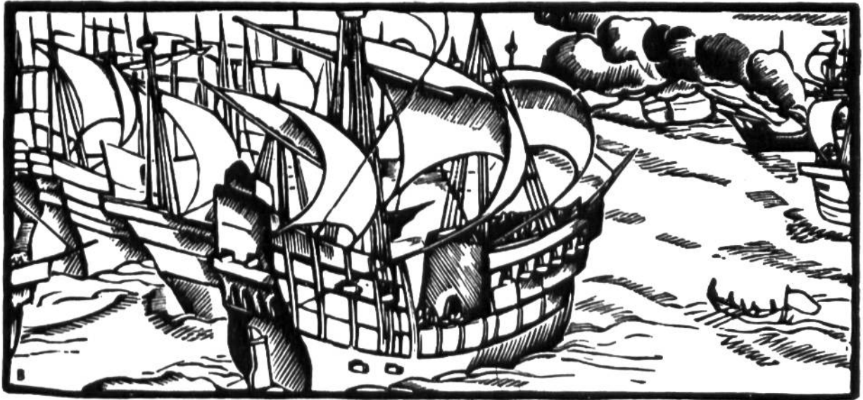
Die Engländer besiegen die mächtige spanische Flotte Armada, 1588.