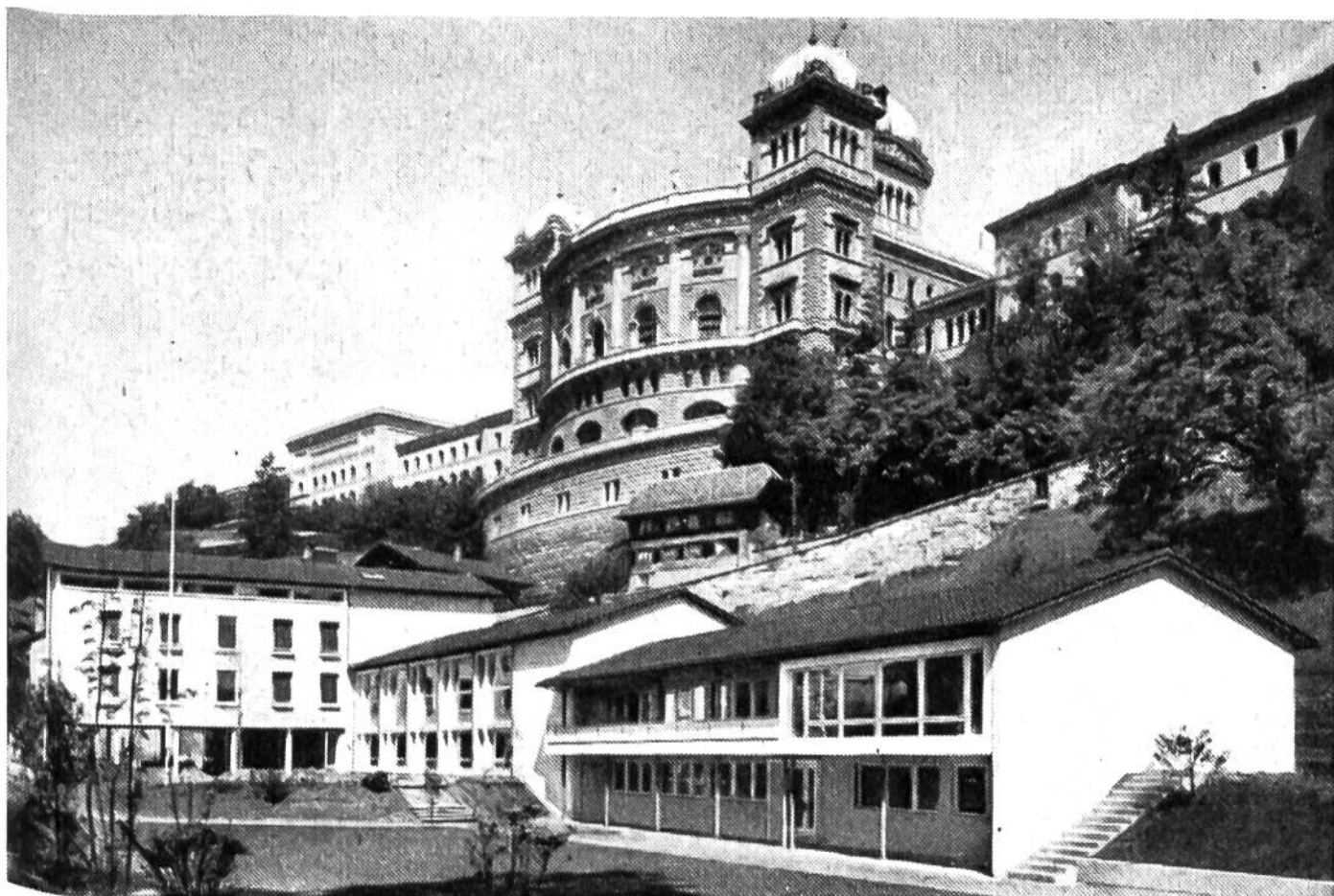
Bundeshaus und Jugendhaus in Bern: Zwei Bauten grundverschiedener Bau-epochen.