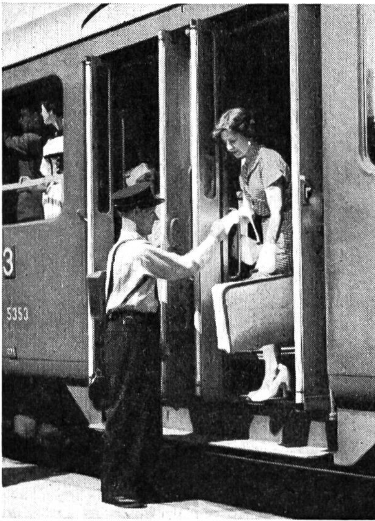
Die helfende Hand des Kondukteurs – ein vertrautes Bild.

Sehr große Bahnhöfe, welche mehr als 13000 Verkehrspunkte aufweisen, tragen die Bezeichnung Bahnhofinspektion . Einige Beispiele: Basel SBB (73281 Verkehrspunkte), Zürich (71 473), Bern (32167), Genève-Cornavin (22 092), Lausanne (16 163). Der Bahnhofinspektor Zürich ist Chef von 2200 Beamten und Angestellten.