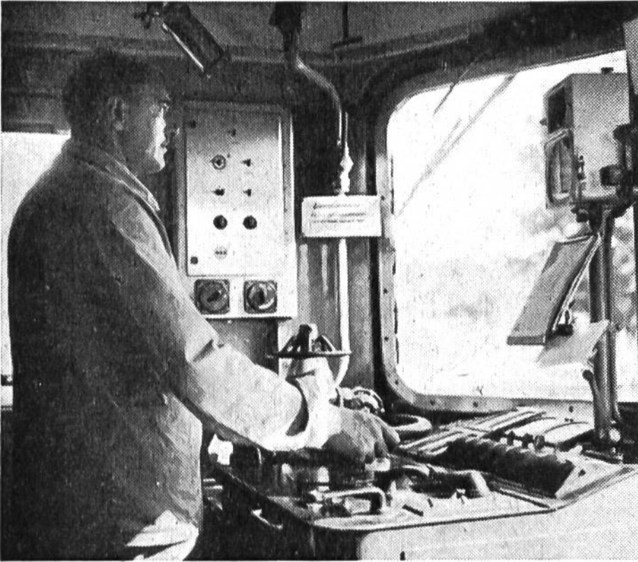
Die Hand am Steuer, den Blick auf die vorbeiflit-zenden Signale gerichtet – so beherrscht der Lokomotivführer die Lokomotive.

(2152 Verkehrspunkte), Martigny (2396), Lugano (5736), Arth-Goldau (5829), Rorschach (7386) und Aarau SBB (11 776).