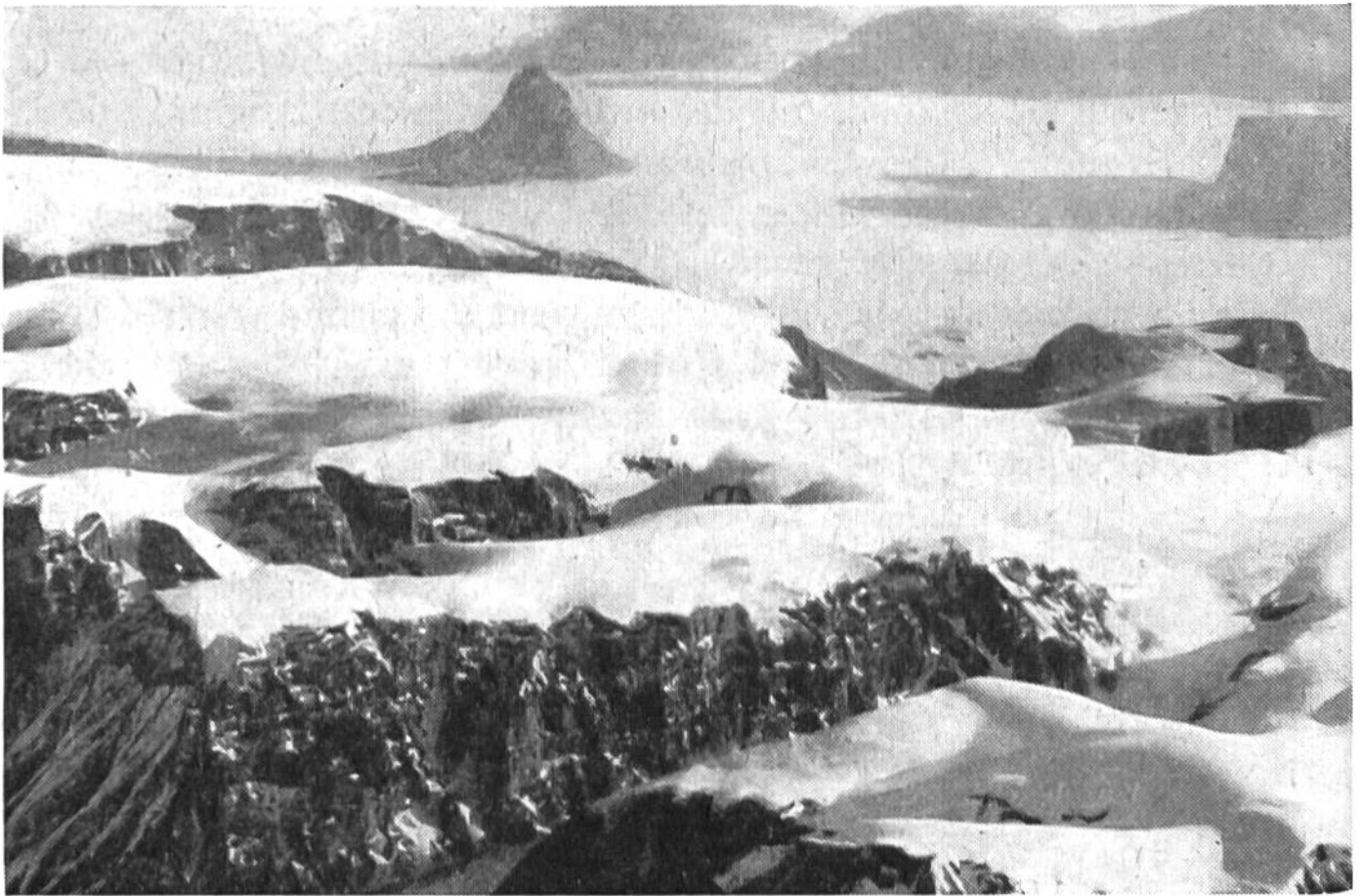
Blick auf das tafelförmige Küstengebirge in der Nähe des magnetischen Südpols.

Die Beschaffenheit des Landes können wir an eisfreien Küstestücken oder an den Gebirgszügen erkennen, die mit ihren Gipfeln über das 2000–3000 Meter dicke Inlandeis hinausragen und von denen der höchste in der Westantarktis bis 6000 Meter emporsteigt. Die Gebirgsketten der Westantarktis sind nichts anderes als die Fortsetzung der südamerikanischen Anden, während die Ostantarktis aus plateau-artigen Gebirgen aufgebaut ist.