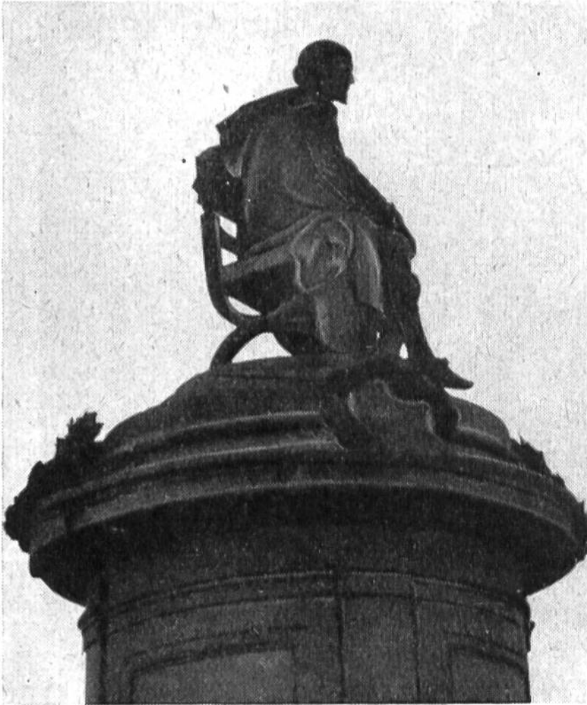
Das Denkmal William Shakespeares, des bedeutendsten Dramatikers der Neuzeit.

schliesslich gutbemittelt an seinen Geburtsort zurückzog, wo er 1616 starb. In den letzten Jahrzehnten entwickelten sich jedoch verschiedene Theorien, nach welchen die berühmt gewordenen Trauerspiele, Lustspiele, Sonette und Epen diesem Schauspieler Shakespeare bloss «unterschoben» sein sollen, in Wirklichkeit aber von hochgestellten Persönlichkeiten des englischen Hofes (Lord Bacon, Earl of Oxford), von einem andern bekannten Dichter jener Zeit (Marlowe) oder gar von einem nach England eingewanderten Italiener geschrieben wurden. Für all diese verschiedenen Annahmen gibt es glaubwürdige Anhaltspunkte, ja treffliche Beweise; uns interessiert hier dagegen – gleichgültig, wer der tatsächliche Schöpfer der «Shakespeareschen» Dramen in Wirklichkeit war – die Wesensart dieses zugleich kundigen und leidenschaftlichen Könners.