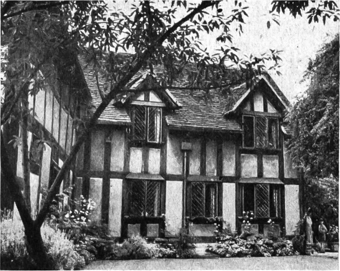
Das Geburtshaus Shakespeares zu Stratford upon Avon.