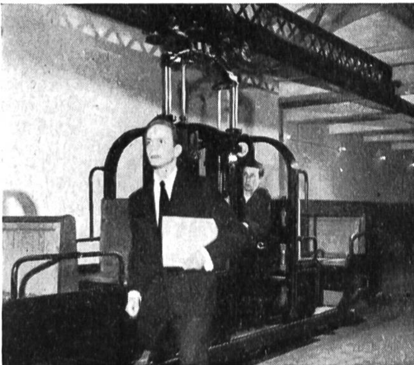
Um die erforderlichen Akten rasch weiterge- ben zu können, benutzen die Pagen eine be- sondere, unter dem Hause liegende Bahn.

zu spitzen, Dutzende von Notizblöcken und Büroklammern zu verteilen und Zeitungen bereitzulegen. Während der Session, die täglich sechs und mehr Stunden dauern kann, halten sich diese klugen und flinken Pagen in einem Wartezimmer auf, um jederzeit für die Parlamentsmitglieder erreichbar zu sein. H. Sg.