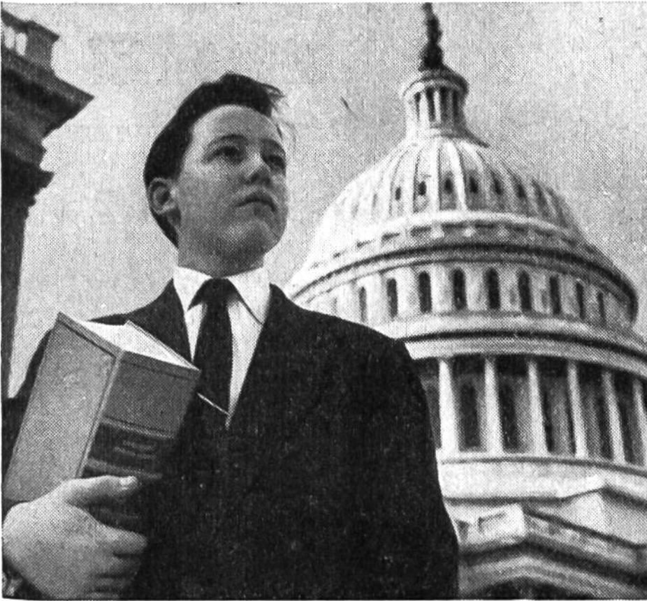
Der fünfzehnjährige Page hat einem Senator ein Gesetzbuch aus der Bibliothek geholt.