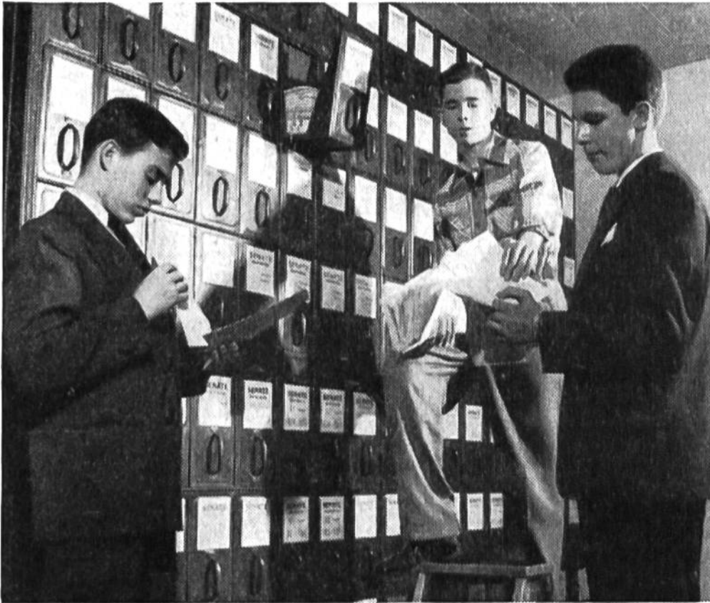
Zwei Pagen holen Rap- porte aus der umfas- senden Kartothek des Staats- gebäudes.

zu spitzen, Dutzende von Notizblöcken und Büroklammern zu verteilen und Zeitungen bereitzulegen. Während der Session, die täglich sechs und mehr Stunden dauern kann, halten sich diese klugen und flinken Pagen in einem Wartezimmer auf, um jederzeit für die Parlamentsmitglieder erreichbar zu sein. H. Sg.