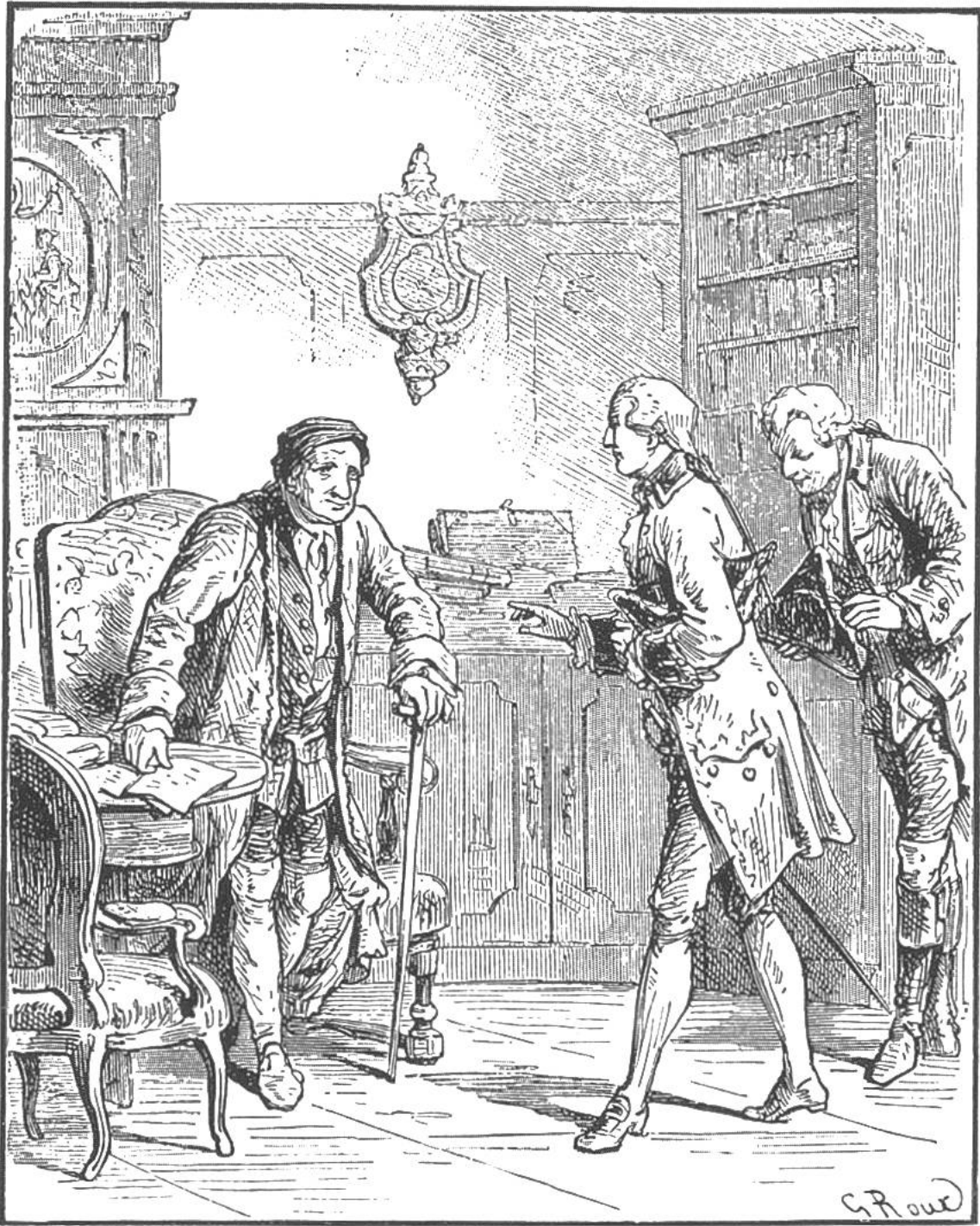
Kaiser Joseph II., der Sohn Maria Theresias, auf Besuch bei Albrecht von Haller, dem grossen Berner Botaniker, Anatom, Physiologen, Arzt und Dichter. Der Besuch fand im Todesjahre Hallers, 1777, statt.

schritt? Dass gerade er diese künstlerische Grosstat vollbrachte, er, von dem man hinsichtlich Gelehrsamkeit und Forschertrieb erzählte, dass er sogar bei seinen täglichen Spazierritten auf Maultierrücken in Büchern las und noch auf dem Sterbebett vor den letzten Atemzügen wissenschaftlich prüfend seinen Puls zählte?