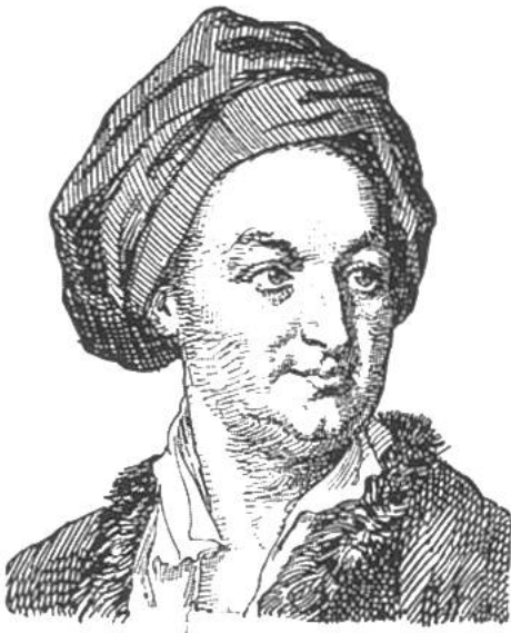
Der Berner Albrecht von Haller