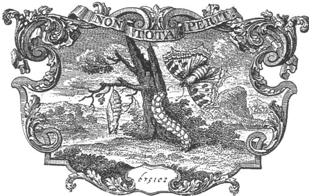
Das Exlibris, auf deutsch das Kennzeichen «Aus der Bücherei», von Haller.

durchaus als Wissenschaftler war er unterwegs. Er jedoch kehrte als Dichter heim. Die bisher grauerregenden Schlünde schilderte er nicht mehr in ihrer Schrecknis, die Bergeinsamkeit nicht mehr als furchtbar. Er beobachtete den herrlichen Sonnenaufgang, die Hirten bei ihrer Beschäftigung, das natürliche, stadtferne und gottnahe Leben. Er besang, so gut er es konnte, das noch Unbekannte. Dichtend unterrichtete er.