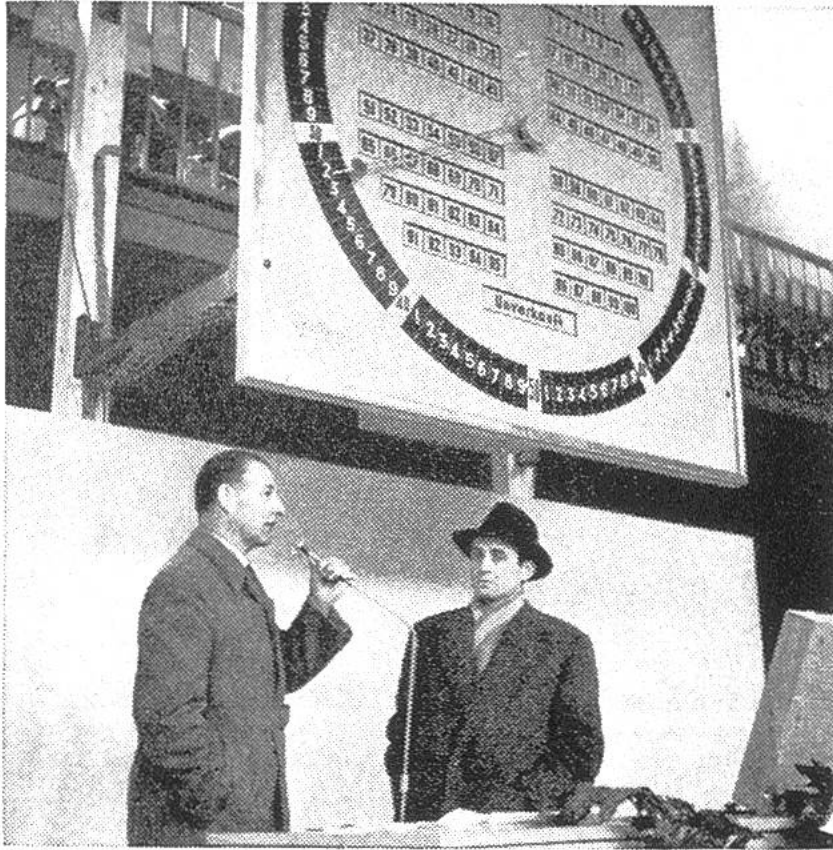
Die Versteigerungsur in Burgdorf zeigt aus- sen die Zahlen für die Preise, innen die Num- mern der Käufer.

In der Schweiz ist eine derartige Versteigerung für Obst und Gemüse «über die Uhr» zum erstenmal im Herbst 1956 in Burgdorf durchgeführt worden. Der Erfolg war so gut, dass die Einführung dieser Methode für 1957 beschlossen wurde. Für Blumen hat sich jedoch vorläufig ein anderes Verkaufssystem auf genossenschaftlicher Grundlage, die «Blumenbörse» in Zürich, als zweckmässiger erwiesen.