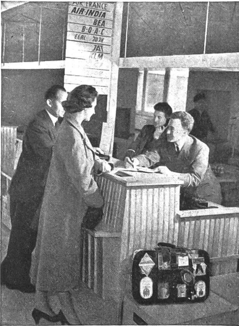
Kontrollieren der Flugscheine am Schalter vor dem Abflug und Abfertigung des Gepäcks.