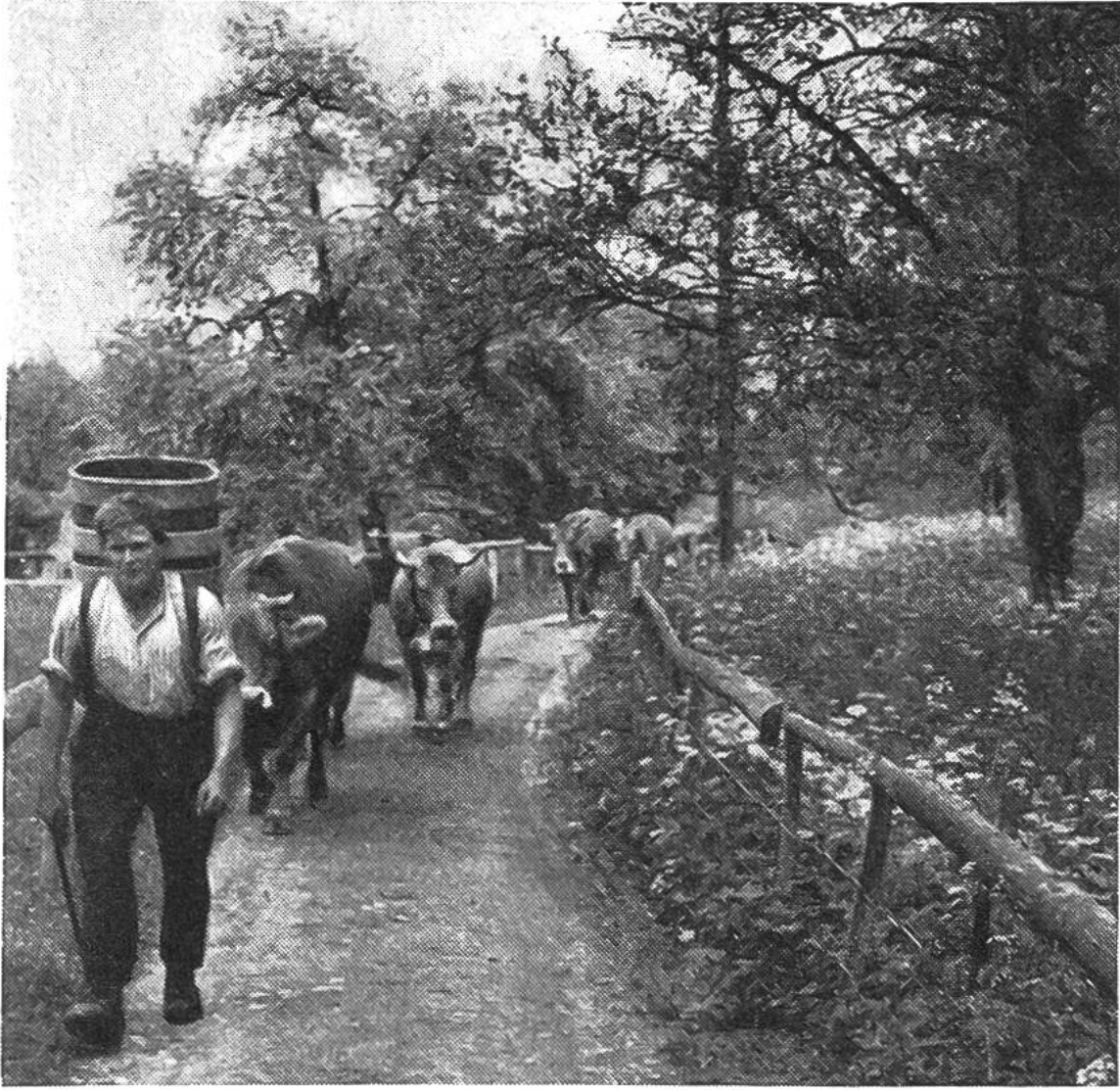
Braunviehherde auf dem Weg zur Frühjahrsweide (Maiensäss).