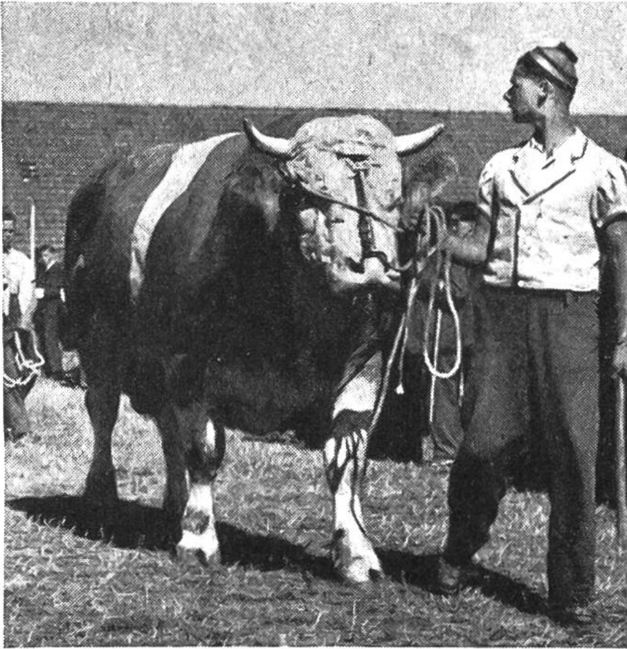
Vorführung eines erstprämierten Zuchtstiers der Simmentaler Fleckviehrasse.

Rund 180000 Bauernbetriebe halten etwa 1,6 Millionen Stück Vieh, davon ungefähr 900000 Milchkühe.