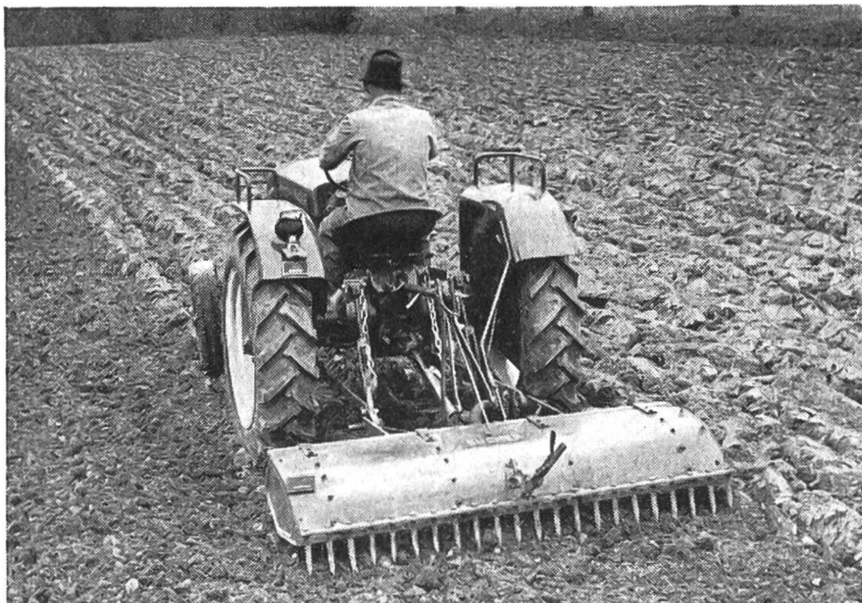
Traktor mit Zapfwellen-Spatenegge bei der Vorbereitung des Feldes zum Säen.

Jahren eine gewisse Bedeutung erlangt, und zwar für bestimmte Maschinentypen, so hauptsächlich für Motormäher und Einachs-traktoren, die in ihrer universellen Verwendungsmöglichkeit eine ausgesprochen schweizerische Entwicklung sind. Leider wird der Export unserer Landmaschinenindustrie durch hohe Zölle sowie andere Schutzmassnahmen des Auslandes stark erschwert.