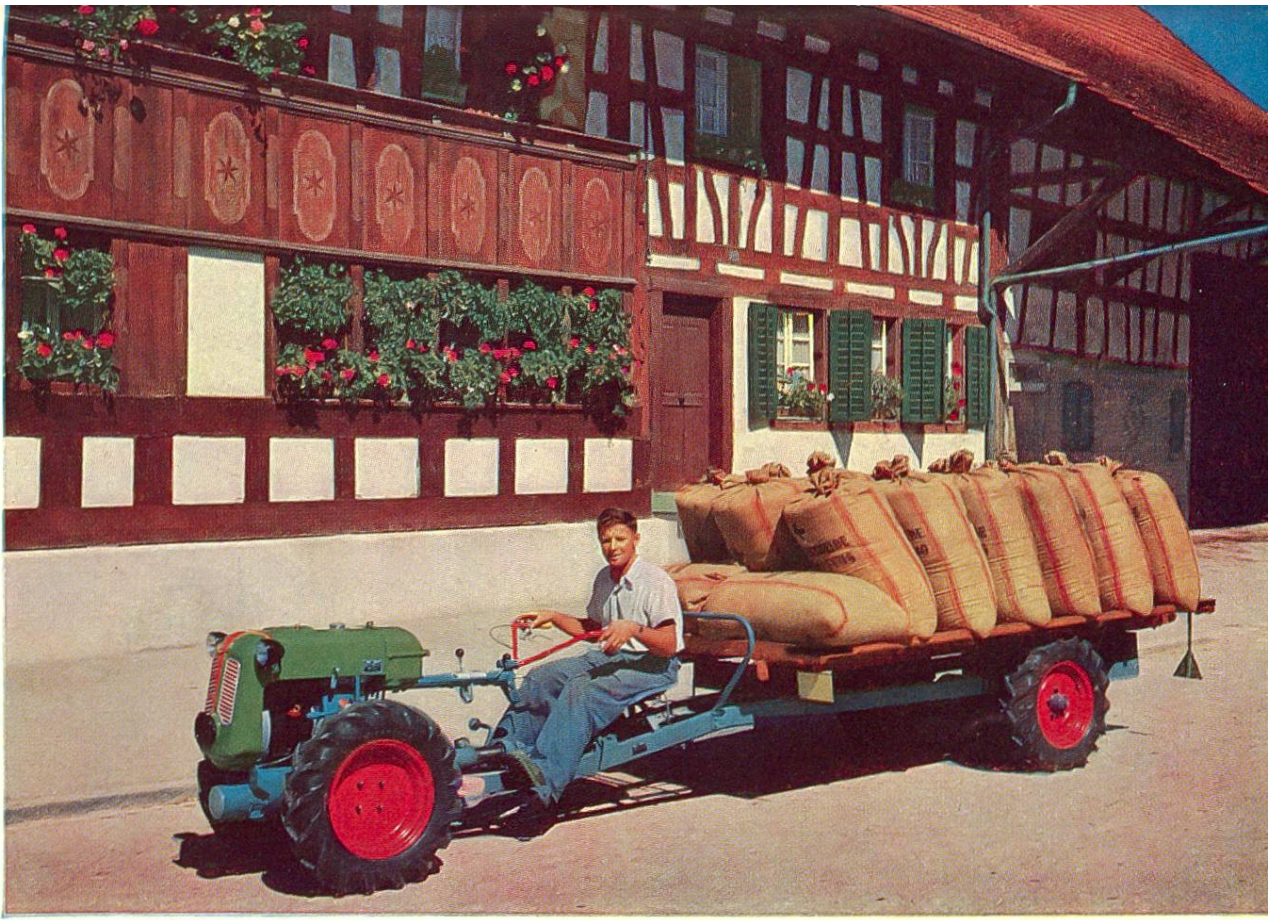
Getreideablieferung in Hettlingen, Kt. Zürich.