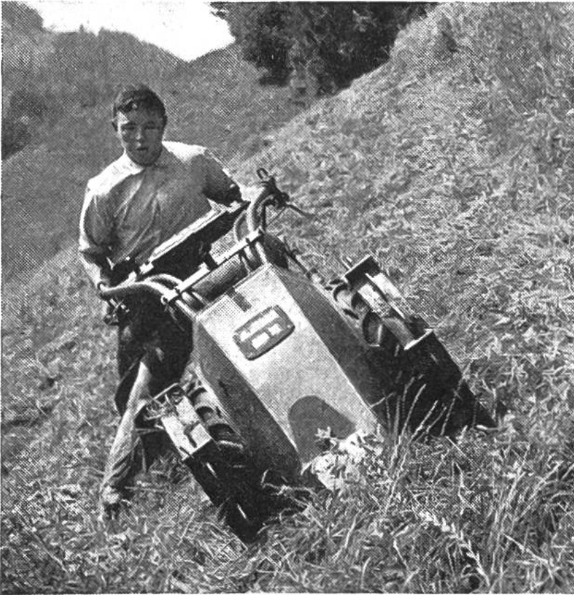
Motormäher mit tiefer Schwerpunktlage am Steilhang. Hier wurde bis vor kurzem mit der Sense gemäht. Der Mann leistet mit dem Motormäher soviel wie 6 kräftige Mäher.

gewöhnlichen Grasmähmaschine die gleiche Arbeit in zwei Stunden und mit einem Motormäher oder Traktor in einer Stunde zu bewältigen. Der Vorteil der Maschine liegt dabei nicht allein in Zeitgewinn und Lohnersparnis, sondern auch in der Möglichkeit, das gute Wetter besser auszunützen. Ähnliche Verhältnisse zeigen sich auch bei den modernen Getreidebindemähern, welche das Getreide nicht nur mähen, sondern gleichzeitig in gebundene Garben ablegen. Eine Motorbaumspritze ersetzt fünf bis sechs Arbeiter mit Rückenspritzen, ein Kartoffelgraber vermag die Handarbeit von zwanzig Mann zu ersetzen und ein Vielfachhackgerät bewältigt die Arbeit von zwanzig Hackern.