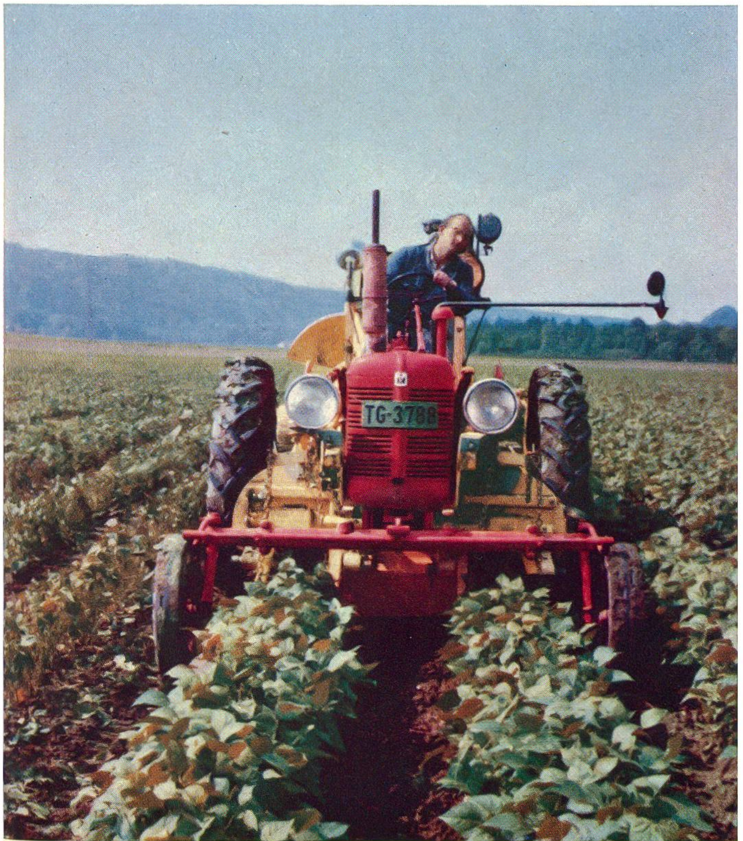
Bohnenernte. Der Apparat zum Bohnenpflücken ist mit dem Traktor verbunden; dieser fährt durch das Feld und pflückt zwei Reihen in einem Arbeitsgang. Mitte und rechts volle Stauden, links abgeerntete. (Siehe Seiten 213–221.)