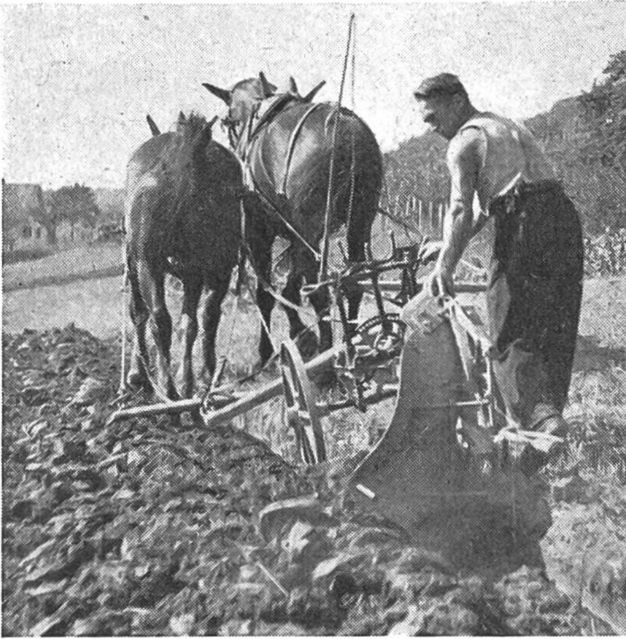
Aber auch das Pferd ist immer noch ein treuer Helfer des Bauern.

fungs- und Unterhaltskosten nicht zu hoch liegen. Die schweizerische Landmaschinenindustrie hat sich diesen Bedürfnissen in ihrer Produktion stets angepasst und bemüht, Konstruktionen hervorzubringen, die es der Landwirtschaft ermöglichen, neue Wege in der Verrichtung der Arbeiten im Hof und auf dem Felde zu gehen.