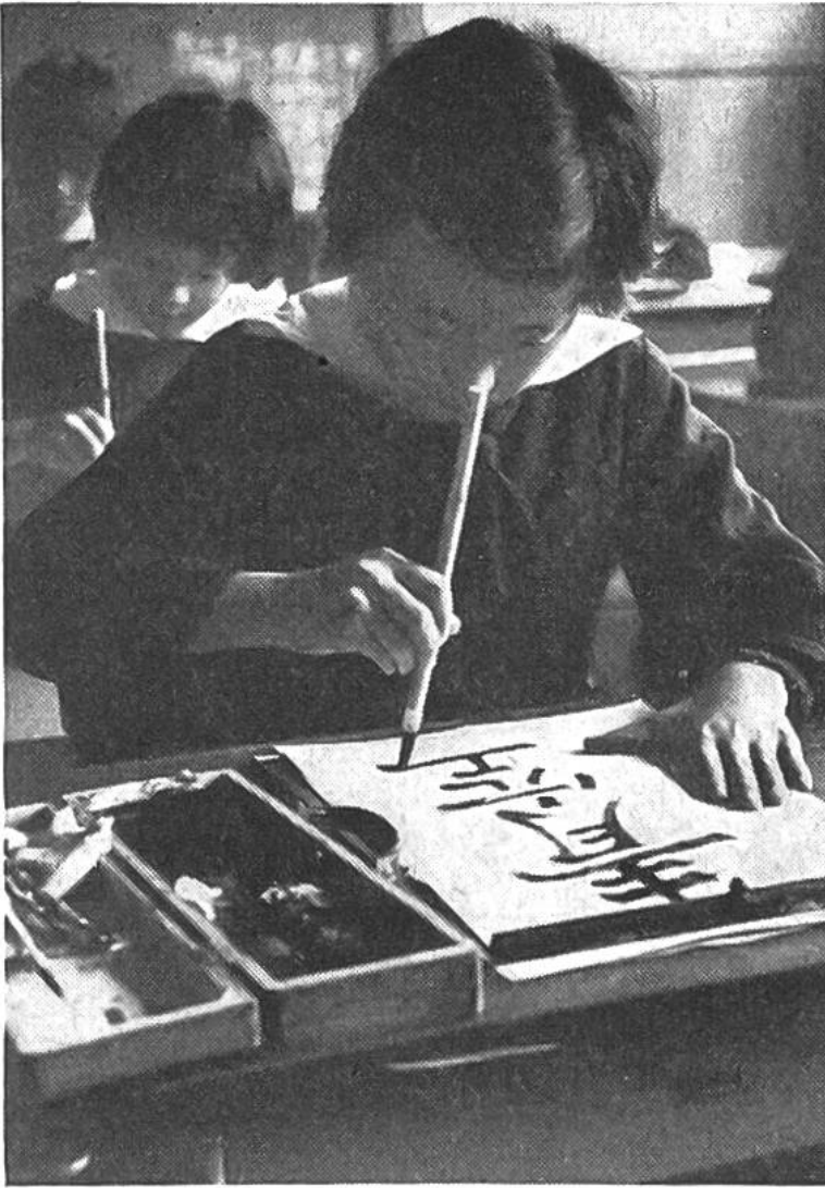
Das Schreiben mit Pinsel und Tusche ist eine Kunst, die japanische Kinder bereits in der ersten Primarschulklasse zu erlernen anfangen.

Handarbeit und Kochen, wobei die Knaben an diesem Unterricht auch teilnehmen müssen. Ausserdem wird das Benehmen im allgemeinen Gesellschaftsleben gelehrt.