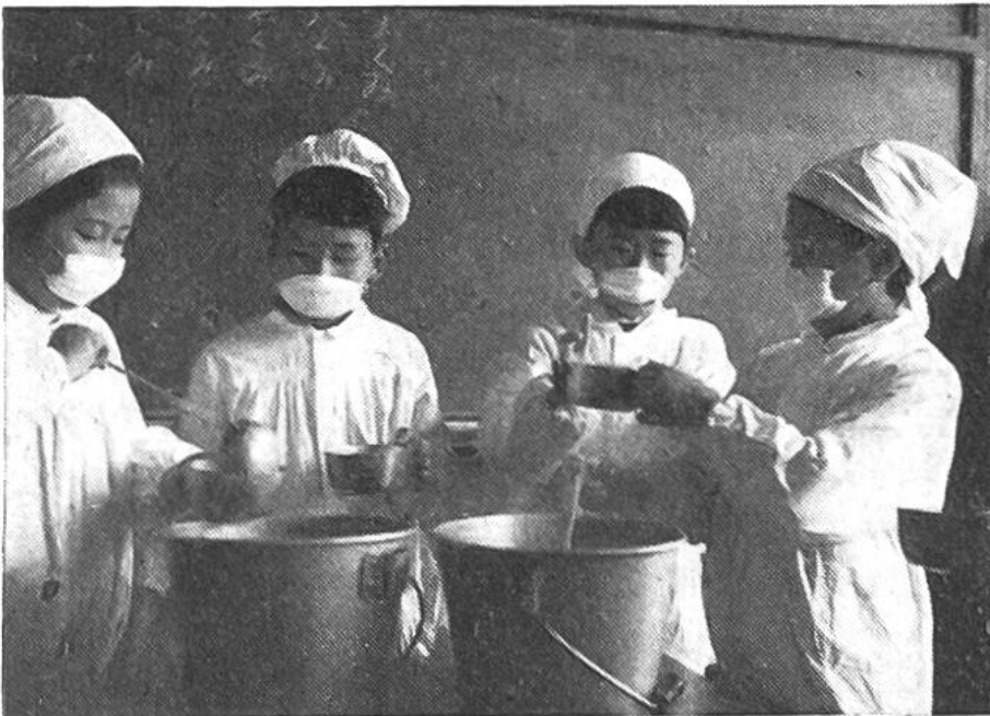
Schüler und Schülerinnen beim Verteilen des Mittagessens. Aus

Reinlichkeitsgründen sind sie vollkommen in Weiss gekleidet und haben noch eine Maske vor Mund und Nase, um das Essen vor ihrem Atem zu schützen.