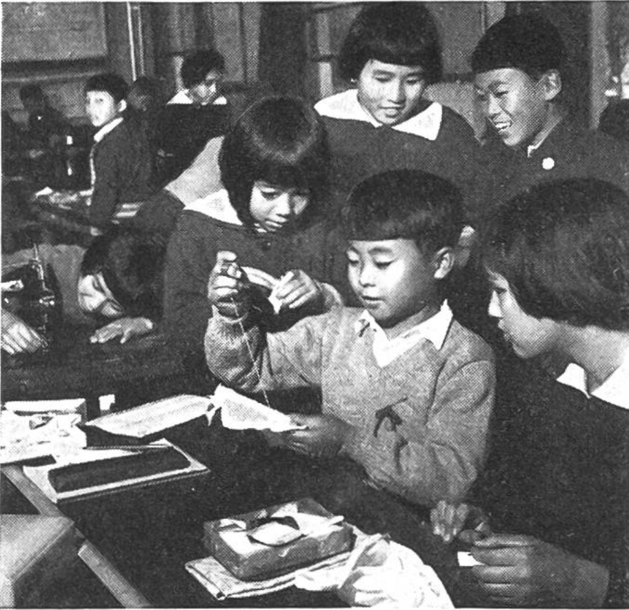
Auch die Knaben müssen sticken lernen. Die Mädchen sind meist geschickter und helfen der Lehrerin beim Unterricht der Knaben.

so hat die Schule an Stelle der Eltern einen grossen Teil der Erziehung übernommen, um auf diese Weise die zukünftige Generation noch aufgeschlossener zu machen.