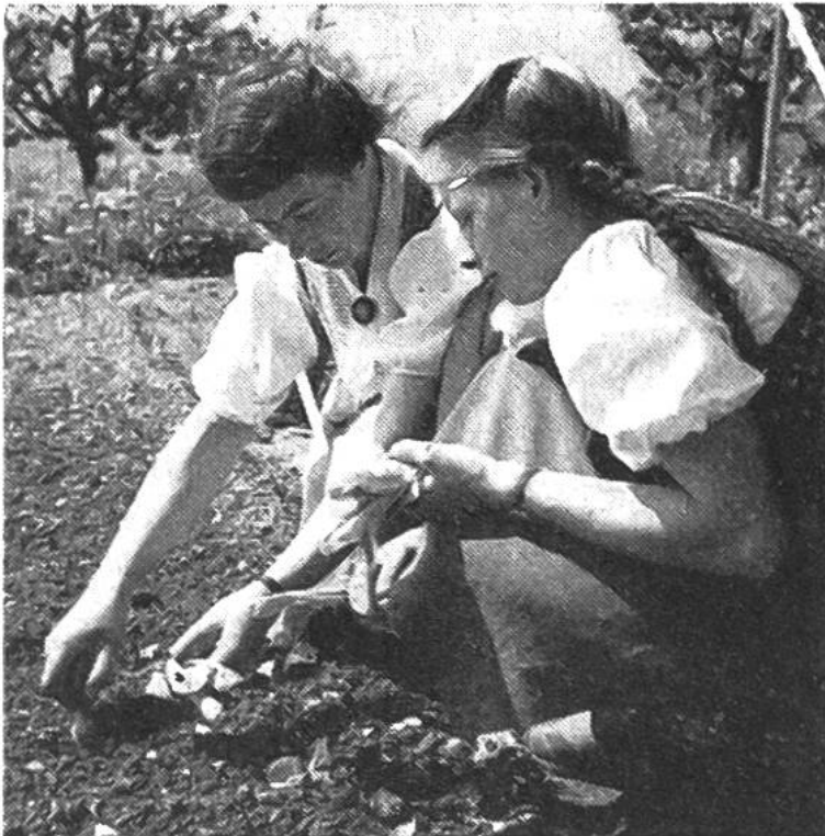
Das junge Mädchen darf lernen zu säen und zu setzen; dabei erwacht auf einmal die Freude an der Gartenarbeit.

lichst viele eigene Produkte zu verwenden. Darum gehört zu einem Bauernhaus auch ein Garten, in welchem vom Frühling bis zum Herbst gesät, gesetzt, gepflegt und geerntet wird. Welche Freude, das Gemüse frisch auf den Tisch bringen zu können! Aber auch Blumen aller Arten blühen im Bauerngarten und an den Fenstern; die Freude am Schönen ist der Bauernfrau angeboren, darum findet sie auch beim strengsten Werchen noch Zeit, ihre Blumen zu pflegen. Die Bauernfrau ist eine Königin in ihrem kleinen Reich.