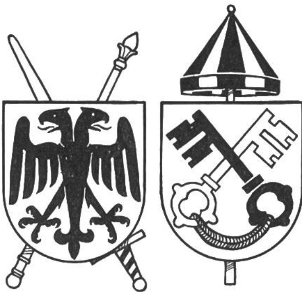
Die Wappen von Kaiser und Papst