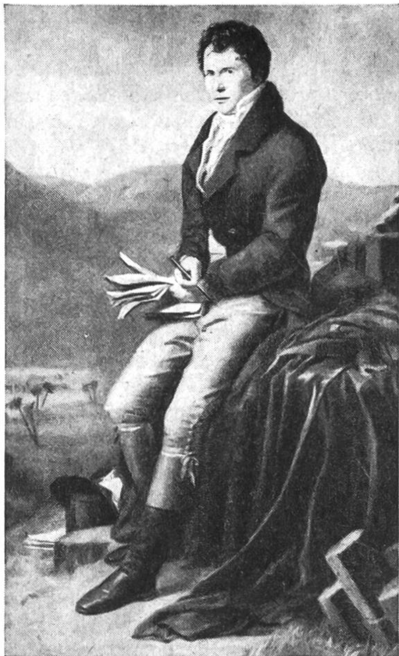
Der junge Alexander von Humboldt in Südamerika, nach einem Gemälde von Karl von Steuben.