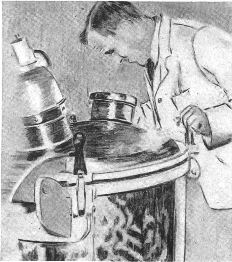
Überwachung des Uperisationsvorganges am Expansionsgefäß.

des 19. Jahrhunderts fällt, hat dann weitgehend das Verständnis für das Verhalten der Milch unter verschiedenen Aufbewahrungsbedingungen gefördert. Es wurde klar, dass alle unerwünschten Veränderungen der Milch auf der Tätigkeit verschiedener Arten von Mikroorganismen (kleinsten Lebewesen) beruhen. Der französische Forscher Louis Pasteur hat in den sechziger Jahren des letzten Jahrhunderts entdeckt, dass Bier und Wein durch Erhitzung auf Wärmegrade unterhalb 100^{\circ}\text{C} während einer gewissen Zeit vor dem Verderben geschützt werden können. Versuche mit Milch zeigten, dass vor allem die pathogenen, d. h. krankheitserregenden Keime abgetötet wurden, eine Erhöhung der Haltbarkeit jedoch nicht zu erreichen war. Dieses Erhitzungsverfahren, später als Pasteurisierung bezeichnet, hat im besondern in seiner Anwendung auf Milch eine weltweite Ausdehnung angenommen. Mit der Entwicklung der Hygiene erstrebte man eine von krankmachenden Bakterien möglichst freie Milch, ein Ziel, welchem