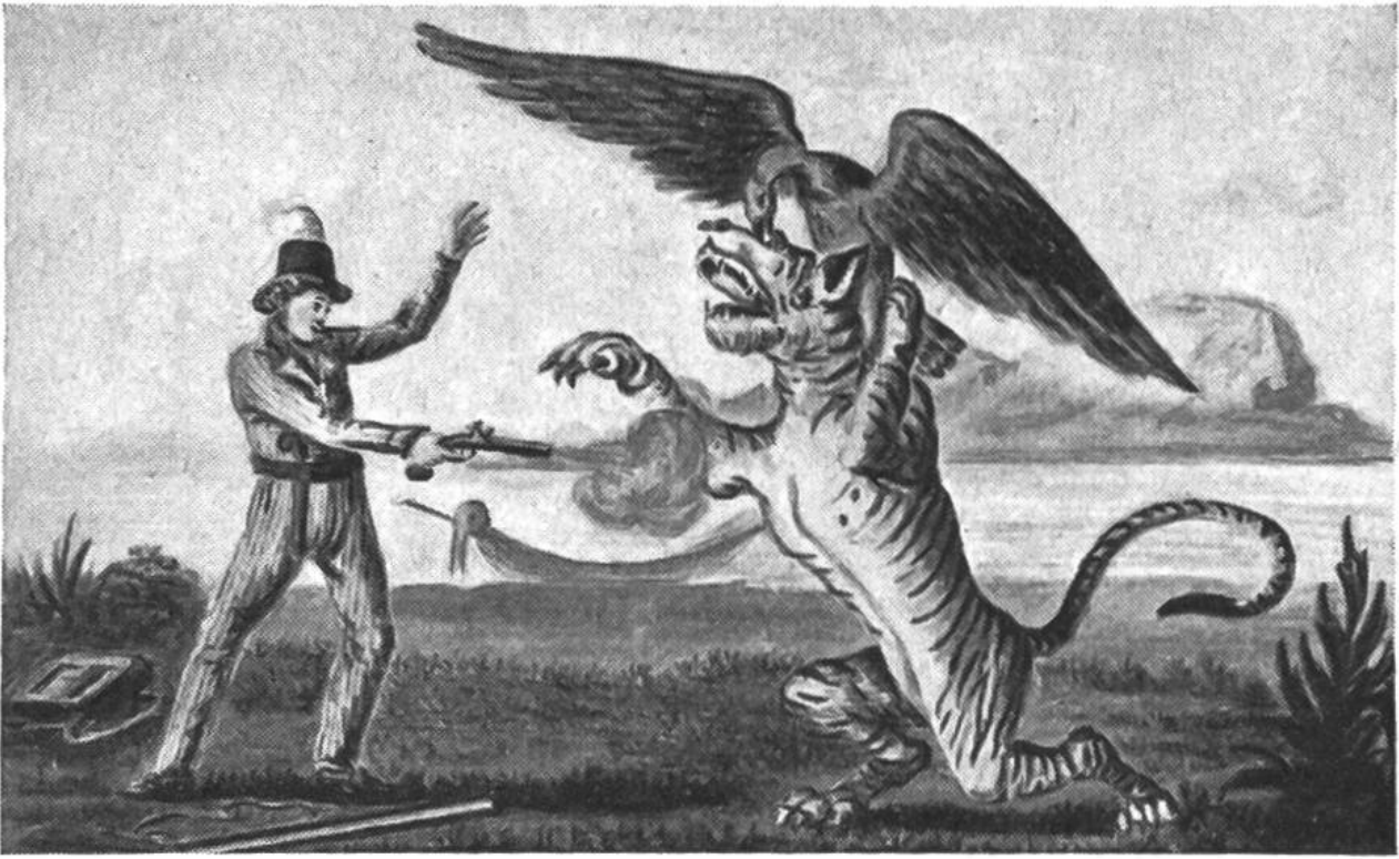
Kampf mit dem Tiger.

Das Buch wurde mehrfach übersetzt und in unzähligen Ausgaben in der Schweiz, Deutschland, Frankreich, Belgien, England, Amerika, Italien, Rumänien, Polen, Schweden und Holland gedruckt und fand bis heute bei vielen Kindern grossen Gefallen.