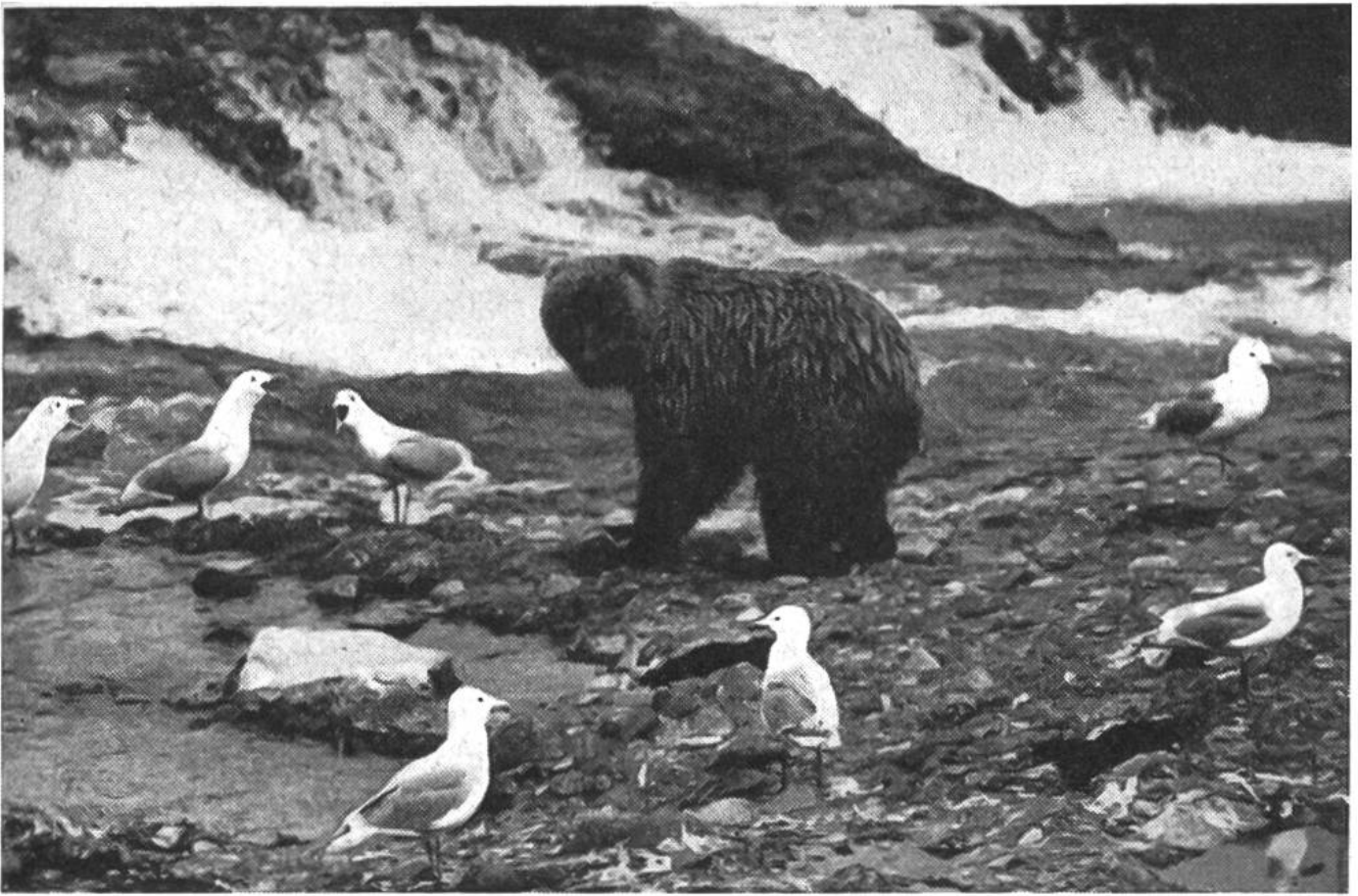
Hungrige Möwen warten in unmittelbarer Umgebung der braunpelzigen Fischer auf Abfälle.

Vor kurzem hat ein Beamter im Auftrage des amerikanischen Fischerei- und Jagddienstes die fischenden Bären von Alaska in ihrer Tätigkeit genau beobachtet. Jeder Bär hat am Fluss oder im Fluss seinen bestimmten Standplatz, den er so lange einnimmt, bis er sich mit den wohlschmeckenden Fischen vollgefressen hat; dann macht er einem seiner Artgenossen Platz, der geduldig gewartet hat. So kommen schliesslich eine ganze Anzahl Petze der Reihe nach zum Fischen und zum Festbraten.