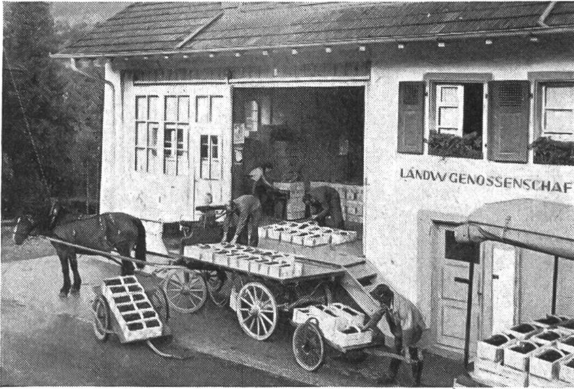
Die Landwirtschaftliche Genossenschaft als örtliche Sammelstelle für Obst und andere bäuerliche Erzeugnisse.