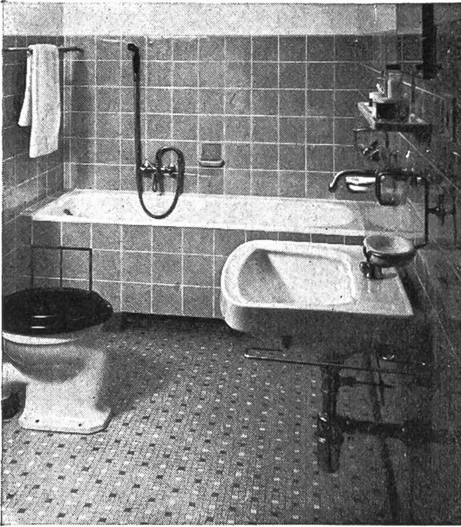
Sanitärkeramik und keramische Wand- und Bo- denplatten ver- breiten im Bad- zimmer das Ge- fühl von Sauber- keit und Frische.

Auch in der keramischen Industrie steht die Zeit nicht still. Ständig werden die Produkte technisch verbessert. Neue Formen und neue Dekors, die dem Streben des modernen Menschen nach sauberen klaren Linien und Flächen entsprechen, werden entwickelt. In allerjüngster Zeit werden die keramischen Beläge und vor allem auch die Gegenstände aus Sanitärkeramik nicht mehr nur in Weiss, sondern in bunten Farben hergestellt. Wie wohl fühlt man sich in Räumen, die mit modernen farbigen Wand- und Bodenbelägen ausgestattet sind! Und wie sauber und erfrischend wirken doch moderne Badzimmer, Duschräume, Toiletten und Garderoben mit blendendweissen oder in zarten Pastellfarben gehaltenen Waschtischen, Duschbecken, Klosetts! Sie alle tragen den Stempel modernen Wohnens: Sie sind zweckmässig und entsprechen gleichzeitig dem Schönheitsempfinden des Menschen von heute.