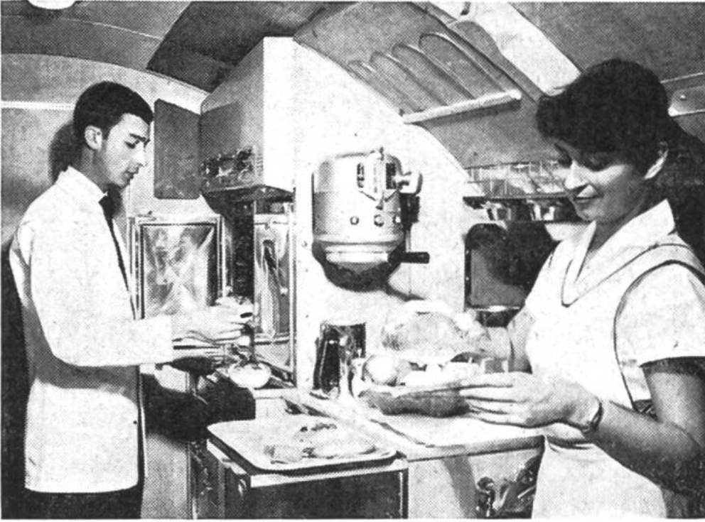
In der Bordküche werden die im Flughafen vorbereiteten Mahlzeiten gargekocht.

der Swissair nur für ihre Afrika-Flüge, bei vielen andern Gesellschaften aber allgemein angewandte Methode, nach welcher die fertig gekochten Essen tiefgefroren gelagert werden, bis man sie auf dem Flugzeug braucht. Eine andere Vorkehrung, um den genannten Schwierigkeiten zu begegnen, besteht darin, dass in den Erstklassabteils der Coronados auf den Südamerika- und Fernoststrecken ein Mitternachtsbuffet mit schweizerischen Spezialitäten aufgefahren wird, das allein schon zwei Hindernisse aus dem Wege räumt: Einmal befriedigt es jene Kunden, deren Appetit sich noch nach eidgenössischer Sitte regt; sodann dient die Vielzahl der gebotenen Leckerbissen den Gelüsten des heimwehkranken Auslandschweizers ebenso wie den mannigfaltigen Diätvorschriften der Mitreisenden aller Rassen und Farben. Der Muselman wird kaum in Brotteig eingebackenen Schinken, dafür aber Bündnerfleisch kosten, das wiederum für den Inder tabu ist. Dieser wird sich seinerseits vielleicht an Hobelkäse laben, während es ein konsequenter Vegetarier mit Tessiner Maiskuchen versucht. Kurz und gut: man hat es sich bei der Swissair hinter die Ohren geschrieben, dass auch die Liebe der Luftreisenden zu den Fluggesellschaften nicht selten durch den Magen geht.