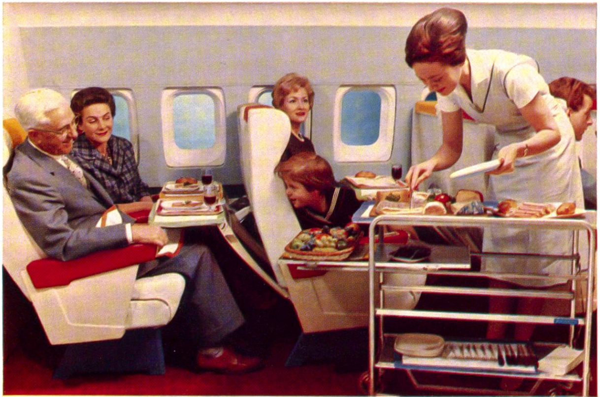
Hostess ist das englische Wort für Gastgeberin. Ihre Hilfsbereitschaft zählt für den Erfolg der Swissair ebenso wie das gute Essen an Bord.