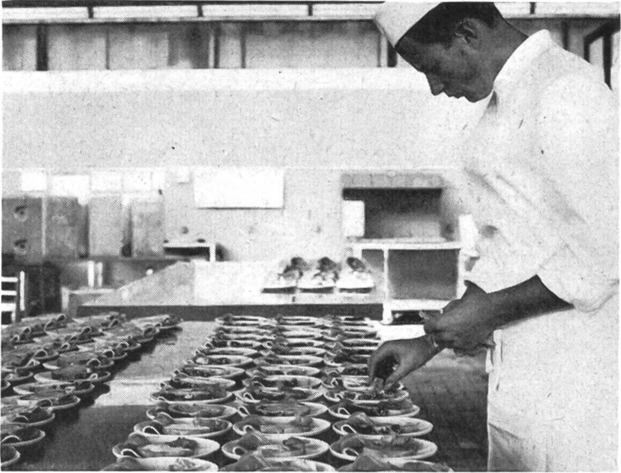
Bis zu 6000 Mahlzeiten und Plättli beträgt die tägliche Spitzenproduktion der Swissair-Flugküche von Kloten.

serviert wird, für unser weltberühmtes Gastgewerbe Zeugnis ablegen. Will die Swissair im lebenswichtigen Wettrennen mit den andern Fluggesellschaften um den besten Service nicht unterliegen, muss sie sich auch in Verpflegungsfragen ausserordentlich anstrengen. Ganz so einfach geht es nämlich nicht, dass man einfach die Wurst von 1922 durch Kaviar, das Brot durch einen Hefekranz und den Thermosflaschenteer durch Champagner ersetzt! Sehen wir uns einmal die Probleme, die sich den Küchenchefs der Swissair stellen, etwas näher an.