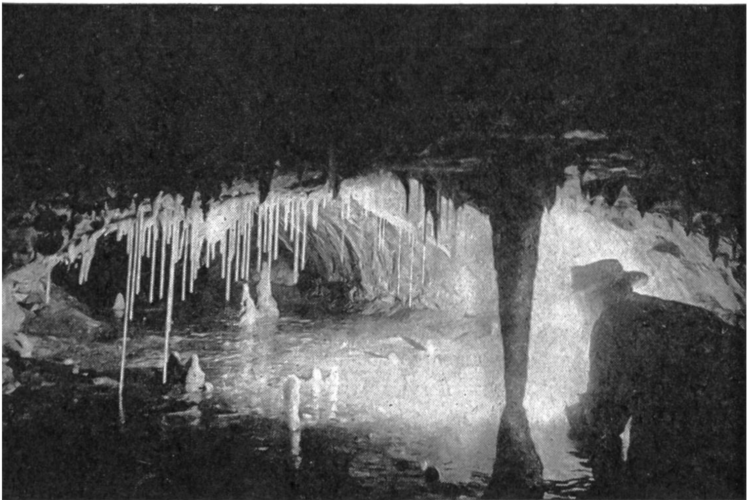
Sinterstäbe überragen die Tropfsteinklippen des Najadenteichs.