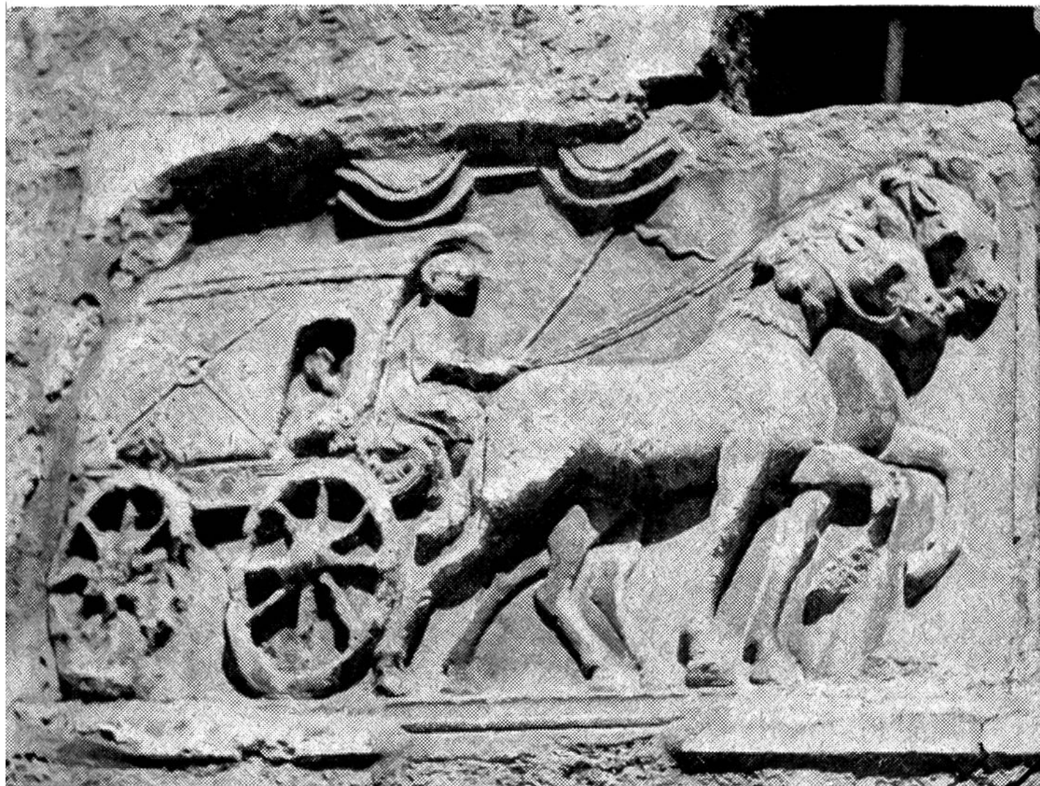
Römische Postkutsche (2.–3. Jahrhundert n. Chr.)

47 nach Christus) errichtet wurde und 37 Meilen von Forum Augusti (Martigny) entfernt steht. Dort wird erneut übernachtet. – Das Ziel des nächsten Tages ist die Passhöhe des Summus Poeninus, dessen Name an einen Berggott erinnert. Dort wird in einem Tempel Jupiter, der Beherrscher der Himmlischen, verehrt. In diesem Heiligtum, dem höchsten Europas, ist ein ständiges Hin und Her von offiziellen Persönlichkeiten und einfachen Leuten, von Kriegern und Händlern, Männern und Frauen, die sich dem Alpengott anvertrauen wollen. Opfer werden dargebracht zum Dank für die bisherige Hilfe beim Aufstieg und mit der Bitte um fernere Unterstützung beim Abstieg