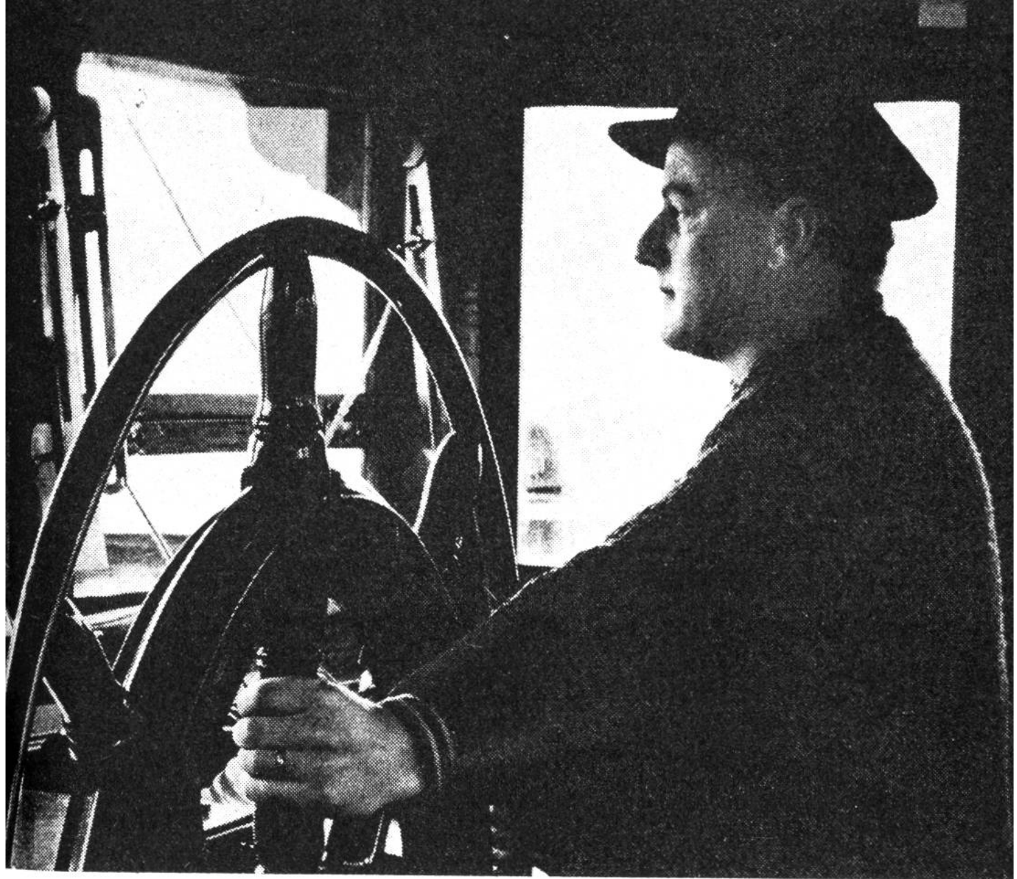
Schweizerischer Rheinschiffsführer am Steuerstuhl.

dass die Wasserstrasse nicht nur die leistungsfähigste, sondern auch die billigste Transportmöglichkeit bietet.