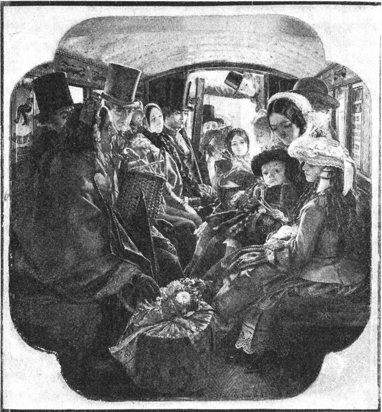
Englische Reisegesellschaft, 1859.

Auch führen die vornehmen Reisenden in eigens dafür eingerichteten Koffern die Gegenstände des täglichen Bedarfs beim Essen und zur Pflege des Körpers mit sich: Essbesteck, Teller, Tassen, Gläser und Kannen, Krüge, Kerzenleuchter, Parfüms und Salbgefäße sowie Reiseapotheke, Schreibzeug, Sonnenuhr und Kompass. Wie sieht die Herrengarderobe aus? Über einer Kniehose trägt der Herr eine knapp anliegende, vorn geknöpfte, knielange, dunkle Jacke mit seitlichen Tascheneinschnitten und