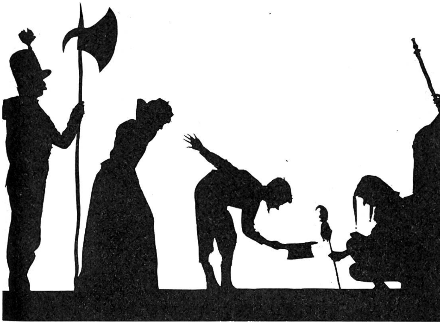
Szenenbild aus: «Das tapfere Schneiderlein».

öffnung eines Kasperltheaters mit Stoff oder durchscheinendem Papier. Dazu genügt eine schwache Lichtquelle: Taschenlampe, Kerze, Leselämpchen.