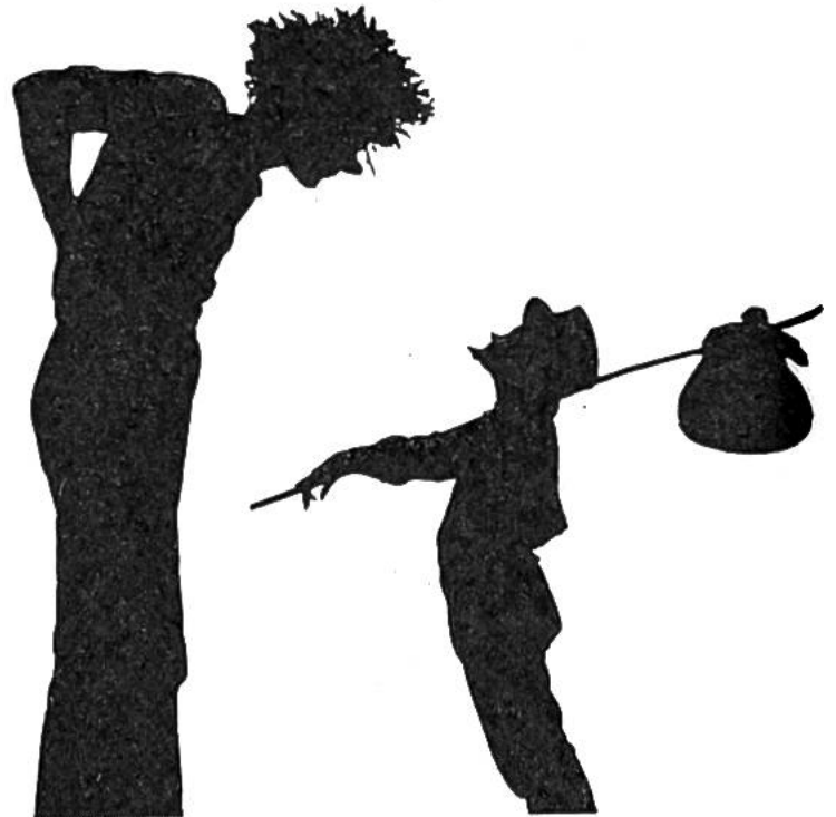
Begegnung Riese–Schneider, aus: «Das tapfere Schneiderlein». Der Darsteller des Riesen steht näher bei der Lichtquelle.

fuss versieht. Auch die Kostümfrage sollte keine Schwierigkeit bereiten. Der Spieler muss ja nur «richtig» angezogen wirken. Kronen, Nasen, Menschen- und Tiermasken formt man aus Karton und befestigt sie mit Gummibändern am Kopf.