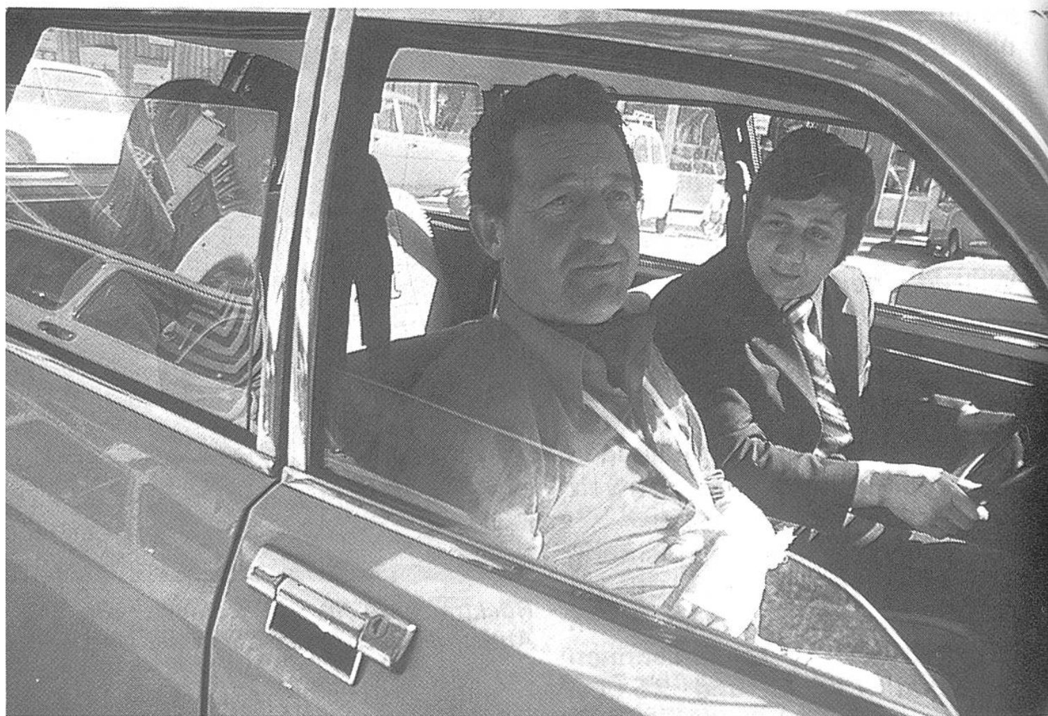
Ein Automobilist hat die Hand gebrochen: Er wird in seinem Auto nach Hause gebracht.

Am 15. Oktober trafen die ersten Nachrichten von der Schweizer Botschaft in Neu-Delhi bei der Alarmzentrale ein, die über den Zustand der jungen Leute orientierten: «Beide Verletzten leiden unter Schockwirkung und werden intensiv gepflegt. Eine erste Operation wurde vorgenommen. Der schnelle Transport von Rishikesh nach Neu-Delhi rettete Fräulein M. das Leben. Trotz aussergewöhnlichen hygienischen Massnahmen besteht grosse Infektionsgefahr.