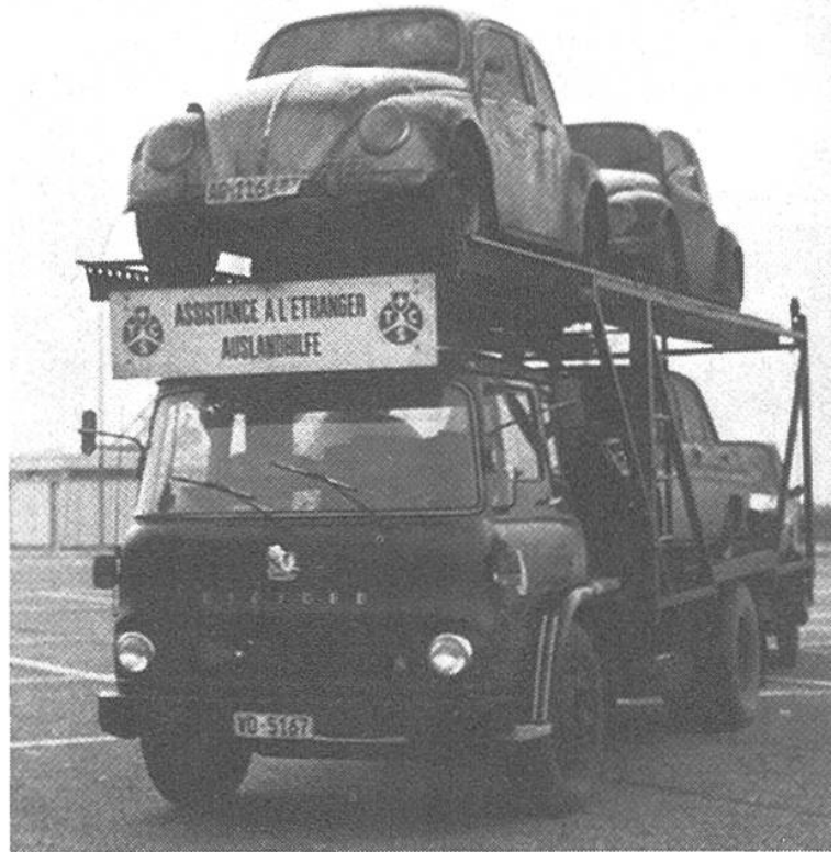
Rücktransport in die Schweiz von Autos, die nicht mehr fahrfähig sind.

schwere Brandverletzungen erlitten. Einen Tag nach dem tragischen Vorfall erhielt die Alarmzentrale von den Schweizer Behörden, die durch deutsche Touristen von diesem Unfall gehört hatten, ein Telegramm. Demzufolge ereignete sich die Gasflaschenexplosion am 12. Oktober in Rishikesh, einem kleinen Dorf, in dem G.B. und C.M. unter primitivsten Verhältnissen notdürftig gepflegt wurden. Zwei Tage später überführte man die beiden Schwerverletzten nach Neu-Delhi. Dort konnte man in einer Klinik die ersten dringendsten chirurgischen Eingriffe vornehmen.