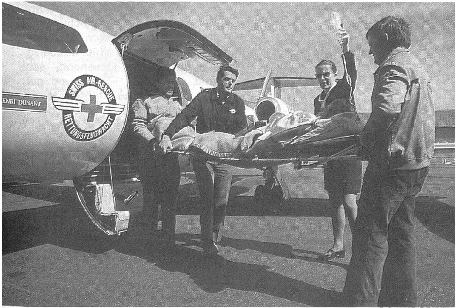
Schwerverletzt im Ausland: die Alarmzentrale vermittelt Hilfe.

sung der Schweizer Touristen entschloss man sich für die Heim-schaffung mit einem Flugzeug der Schweizerischen Rettungsflugwacht (SRFW). Am 20. Oktober startete in Zürich ein Lear-Jet der SRFW mit ärztlichem Begleitpersonal. Am 21. Oktober landete das Flugzeug mit den Verletzten an Bord bereits wieder in Kloten. Sie wurden dann unverzüglich ins Zürcher Kantonsspital überführt und erhielten dort die nötige Pflege.