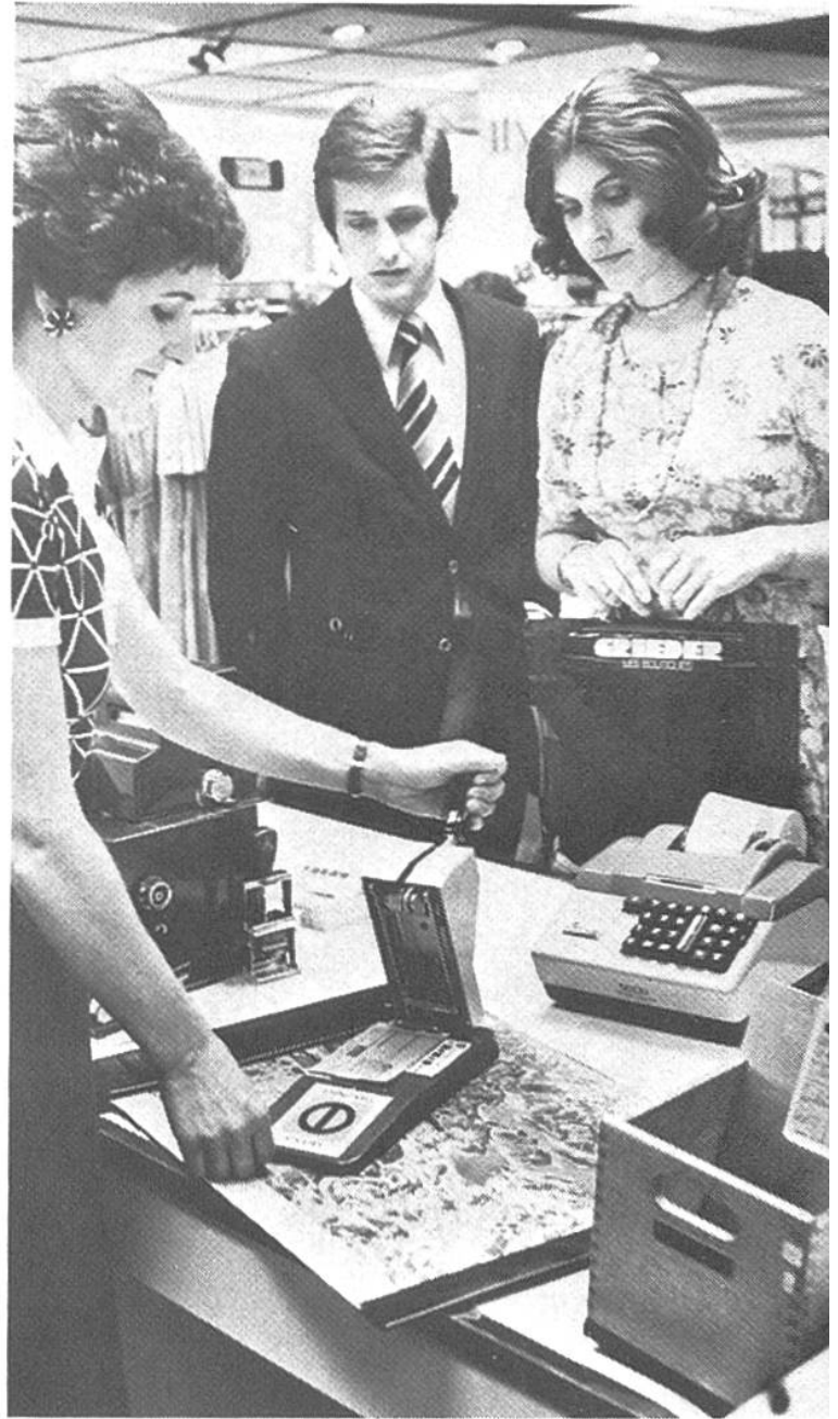
Auch Warenhäuser machen im System der bargeldlosen Zahlung mit.

So können wir heute, ohne Angst vor Dieben, rund um die Welt reisen. Unser Zahlungsmittel ist der